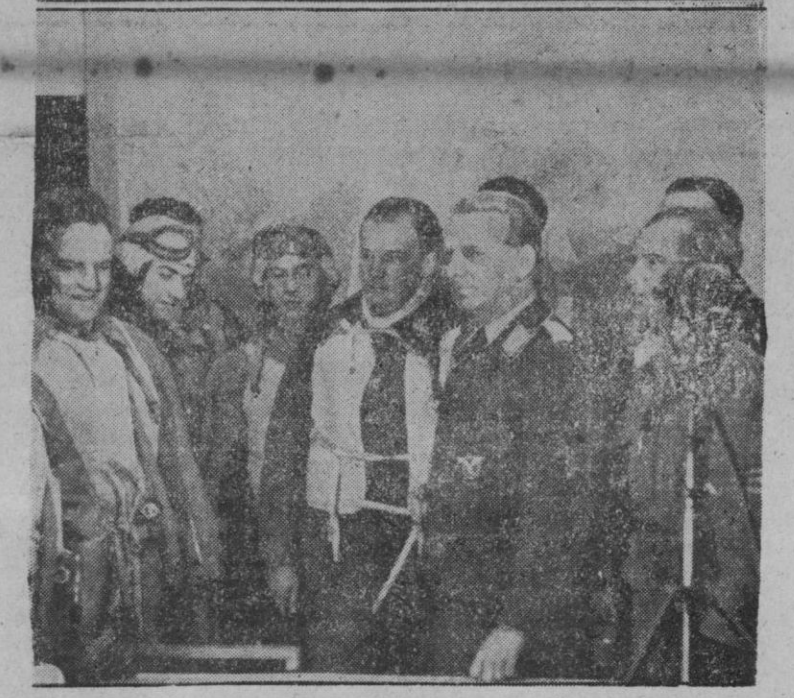
LOS ATACANTES DE «SCAPA FLOW».— Los tripulantes de la escuadrilla que durante dos veces consecutivas actuaron contra la base de «Scapa Flow» son entrevistados ante el micrófono por un periodista del servicio de prensa alemán, al que relatan los éxitos de los que los..

En Zavellá 17 debes, católico mallorquín, inscribirte si quieres ir a la Peregrinación a Zaragoza. Acuérdate de que la de la Virgen del Pilar es una adoración esencialmente española.