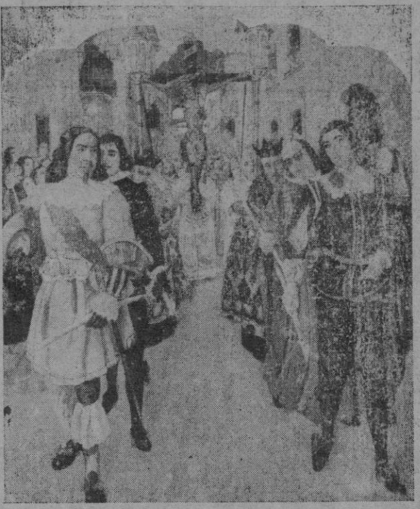
Pública rogativa sacando en procesión el Cristo del Nogal. El desfile va por la calle de los Olmos, a cuyo fondo se divisa la que fué «Puerta Pintada». (Otro de los «panneaux» del mismo retablo)

Para el retablo ha elegido el pintor diversos de ellos: Una monja paralítica del propio convento de Santa Margarita—cuadro que tiene por fondo las arcadas de su patio de las que restan hoy tan solamente dos, habiendo sido otras llevadas a Miramar por el Arzobispo Luis Salvador—curada de su mal; un lego mercedario que al invocar al Cristo cuando caía casi desde el techo de su iglesia fué recogido en un andamio de modo incomprensible