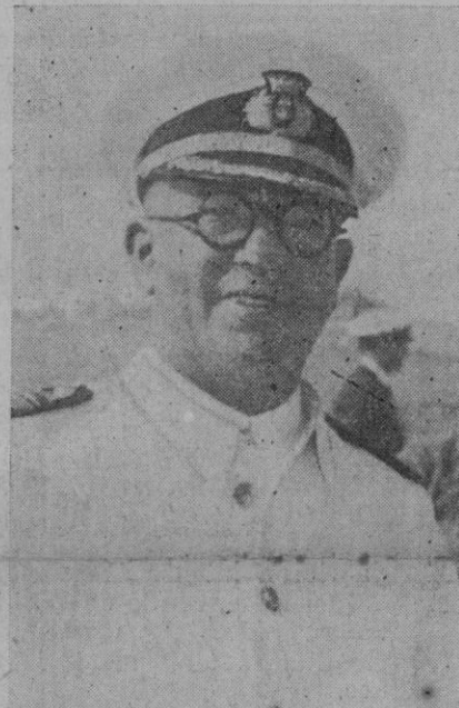
El Almirante Vierna, que murió gloriosamente en el hundimiento del «Balears»

Desde que existe la moderna Turquía—1921—las relaciones de este país con Rusia han sido siempre normales y este país devolvió a los turcos la región del Cáucaso que el Zar se adjudicó por el Congreso de Berlín. Turquía no tiene intención de entrar en la guerra. Sólo los ingleses y franceses están interesados en un posible conflicto, ya que Turquía, con sus terremotos y sus desgracias necesita de la paz y del reposo para construir.