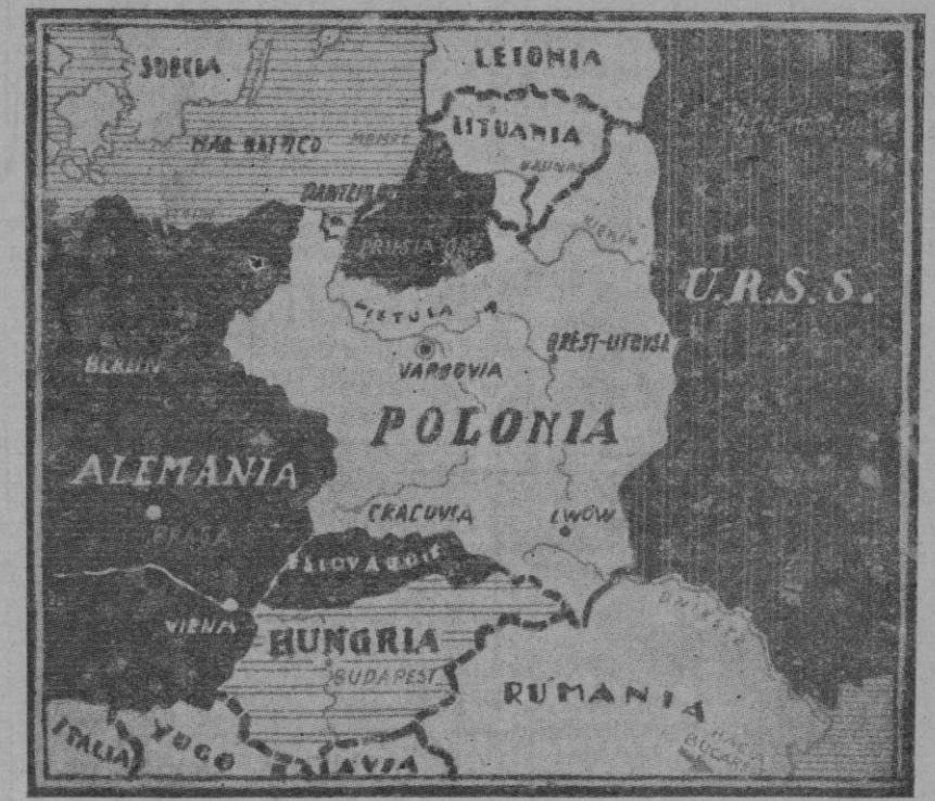
MAPA DE POLONIA Y NACIONES FRONTERIZAS

Esta última parte no deja de ser curiosa. Por vía diplomática ha tratado reiteradamente el Canciller Hitler de resolver las diferencias que