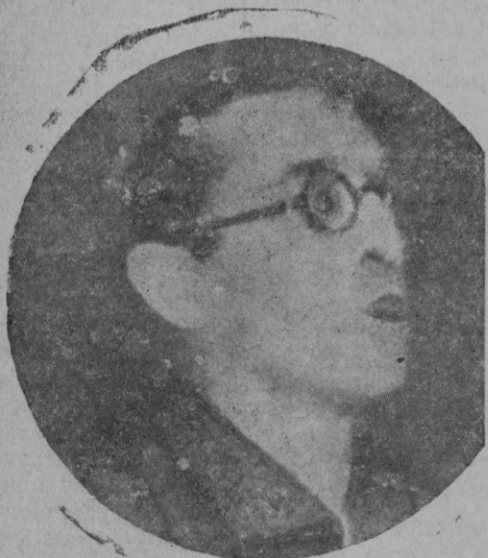
El Ministro sin cartera: don Rafael Sanchez Mazas