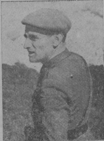
El Ministro del Partido: General Muñoz Grande