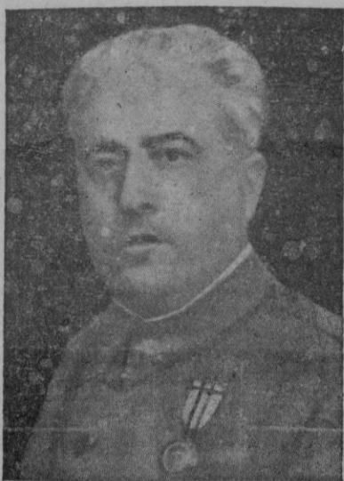
El Ministro del Aire General don Juan Yagüe