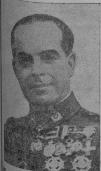
Ministro del Ejército General don José Enrique Varela