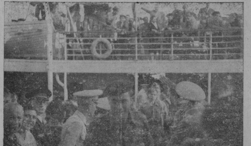
Momento en que empieza el desembarque de nuestros paisanos que llegaron ayer a Palma de regreso de la campaña victoriosa

Le contestó el General, agradeciendo el acto y las palabras del Auditor. Dijo que marchaba con la satisfacción de haber hallado en todo momento cooperación y ayuda a su esfuerzo.