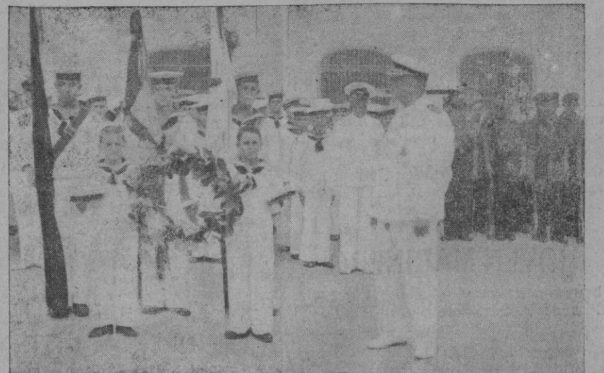
Una interesante fotografía. Los Flechas Navales depositando una corona de flores ante la tumba de los Caídos en Ceuta