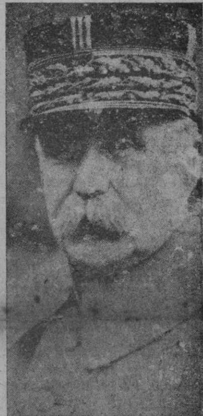
Una reciente fotografía del mariscal Petain, embajador de Francia en España

El Cardenal Pacelli nació, como hemos dicho en Roma el 2 de marzo del año 1876. Hizo sus estudios en la capital de Italia, y allí obtuvo el título de profesor de Derecho Canónico. El Cardenal Gasparri fué quien le aconsejó que dejase la espeñanza para dedicarse única y exclusivamente a las cuestiones vaticanas, siendo nombrado por el Papa Pio X,