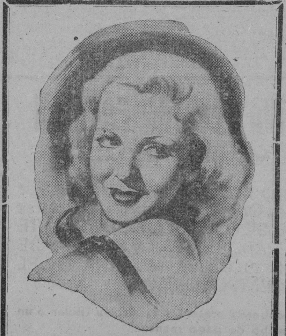
La encantadora estrella JEAN ARTHUR, protagonista de la gran película EL SECRETO DE VIVIR, que se estrena hoy en el TEATRO PRINCIPAL,