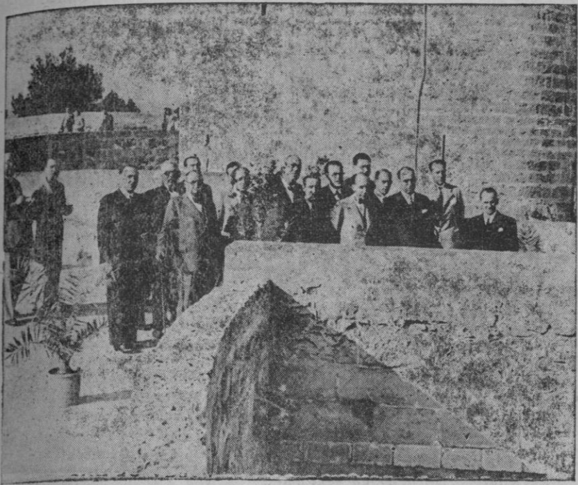
Autoridades e invitados que asistieron a la inauguración del Museo Municipal en Bellver.

Una fiesta interesante.— La Prisión de Jovellanos relicario de la cultura de Mallorca.— Deber de los mallorquines de engrandecer al Museo