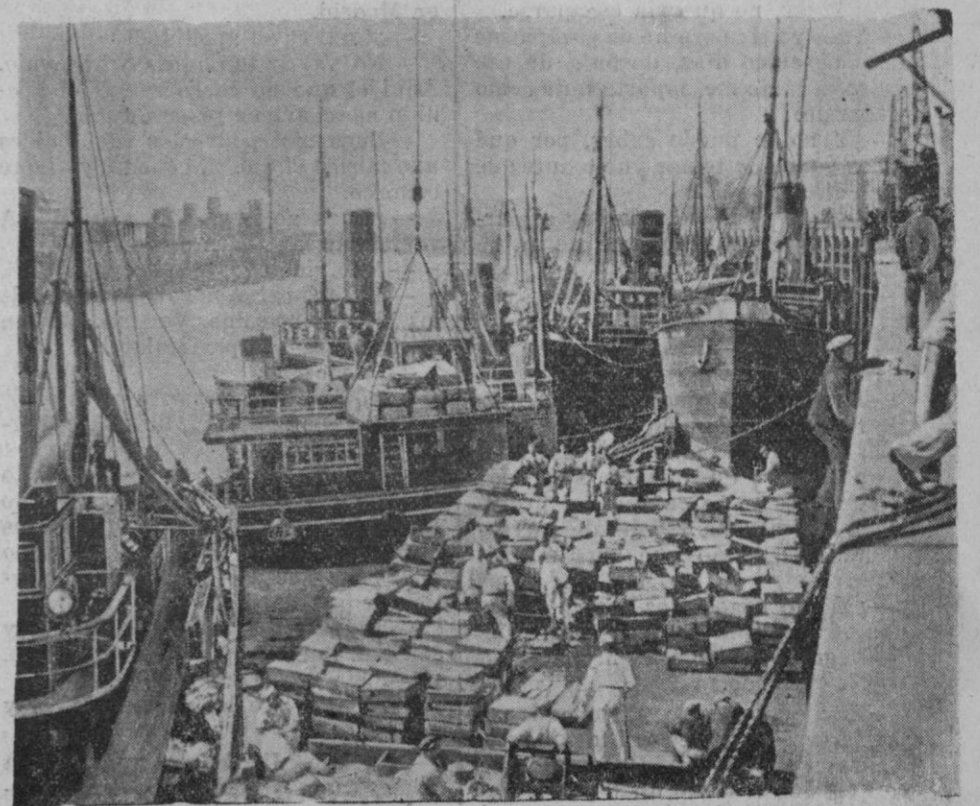
En Boulogne arrojan al mar 200.000 kilos de pescados. Como consecuencia de la paralización de transportes del puerto de Boulogne, han tenido que ser arrojados al agua 200.000 kilos de pescados que estaban en malas condiciones. Una vista de la operación.