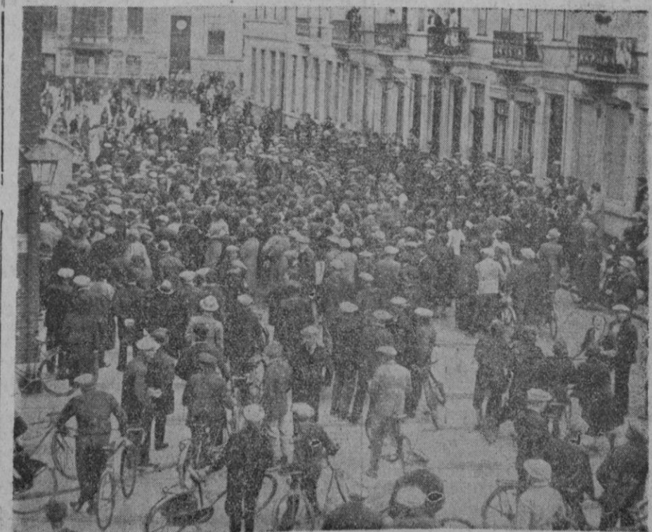
En el puerto de Amberes una huelga que había desde días ha llevado a los obreros de la ciudad a la huelga general. Aquí en la foto los obreros en un intento de organización de una manifestación.