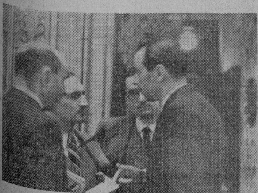
El Ministro de Trabajo Sr. Irujo Vallesca, reunido en los pasillos de la Cámara con los diputados catalanes para cambiar impresiones sobre el momento político.