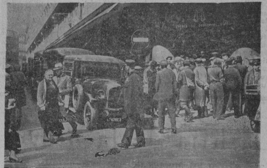
La huelga de los periódicos de París. Camiones conducidos por los huelguistas de París bloquearon las Mensajerías Hachette. Como consecuencia de ello París se ha quedado casi sin periódicos. La cifra de huelguistas llegaron a pasar del millón.