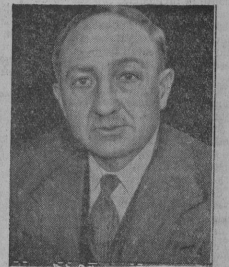
Mr. Yvon Delbos, nuevo ministro de negocios extranjeros de Francia en el Gabinete Blum, y que según parece mantendrá la anterior política del ex Ministro M. Flandin.

Con tal firmeza acusó siempre su personalidad Castilla, tal empeño tu-