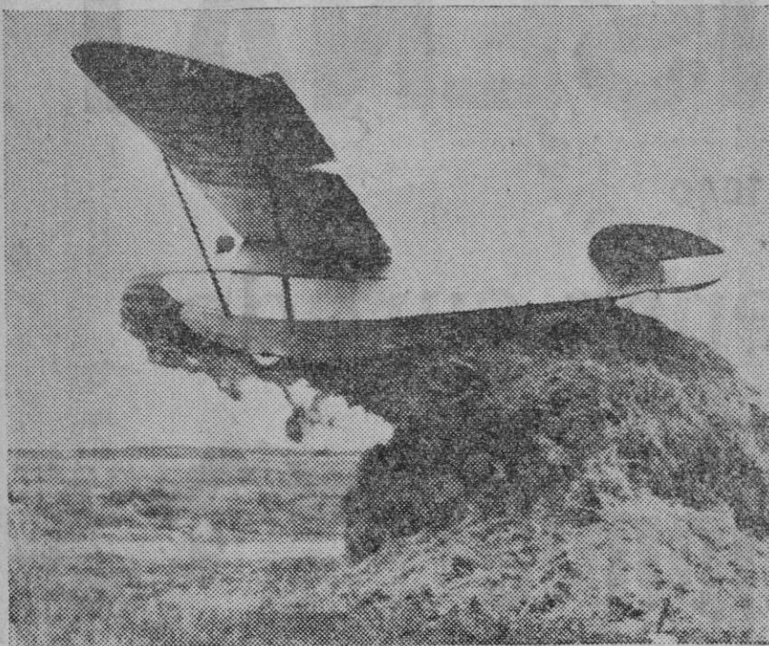
El aviador americano Stevens, batiendo el record de loopings, cuando había realizado 54, cayó sobre un pajar, quedando en la posición que se ve en la foto.

Leno el palacio del Jefe de sumptuosidad árabe, y lo decimos así porque ésta es muy distinta de la sumptuosidad europea. Son de ver aquellas solitarias galerías magníficas, los patios solitarios bañados de una luz igual y difusa, en el rumor manso del agua que brota de la taza central y llena de frescura el ambiente, en el cuadro regular de sus arcaicas arábes. Todos los palacios arábes que hemos conocido en Rabat