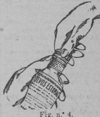
Fig. n.º 4.

Por consiguiente, todo frasco que no lleve las cápsulas cuyas características y grabados insertamos, según figuras núms. 1 y 2, para mayor conocimiento del público, debe ser rechazado, pues en este caso se trataría de una falsificación. Asimismo rechace el SERVETINAL vendido a granel, pues también es falso.