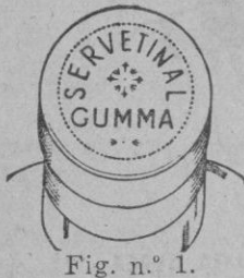
Fig. n.º 1.

Esta cápsula es plateada por los lados y granate en su parte superior, con una inscripción en relieve formada por el mismo metal de la cápsula, que dice SERVETINAL GUMMA; la palabra SERVETINAL de forma circular y la palabra GUMMA recta, debajo de la que dice SERVETINAL. Véase figura número 1.