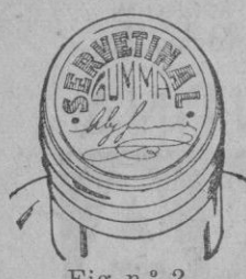
Fig. n.º 2.

Esta cápsula es totalmente plateada, o sea, del mismo color natural del estaño; en su parte plana superior, o cabeza, ostenta una inscripción en relieve formada con tinta de color encarnada, que dice SERVETINAL GUMMA, y debajo de esta inscripción, la firma del autor. Véase figura número 2.