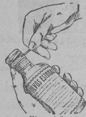
Fig. n.º 3.

En su parte lateral, adaptada al cuello de la botella, se ha practicado un corte con dos puntas; tírese por cualquiera de ellas y entonces queda la cápsula convertida automáticamente en un tapón de rosca. Véase figuras números 3 y 4.