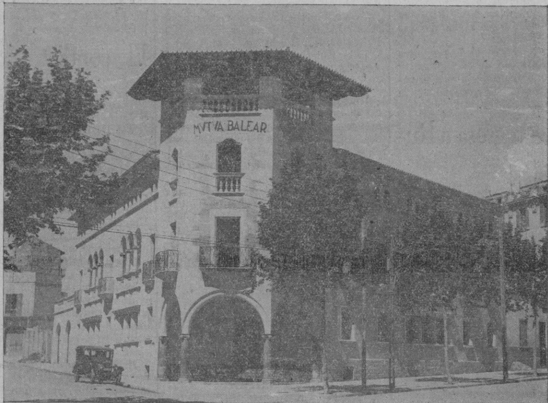
Vista general del espléndido edificio de la Mútua Balear (Mutualidad de Accidentes de Mallorca), construido especialmente para instalar en él sus dispensarios y oficinas.