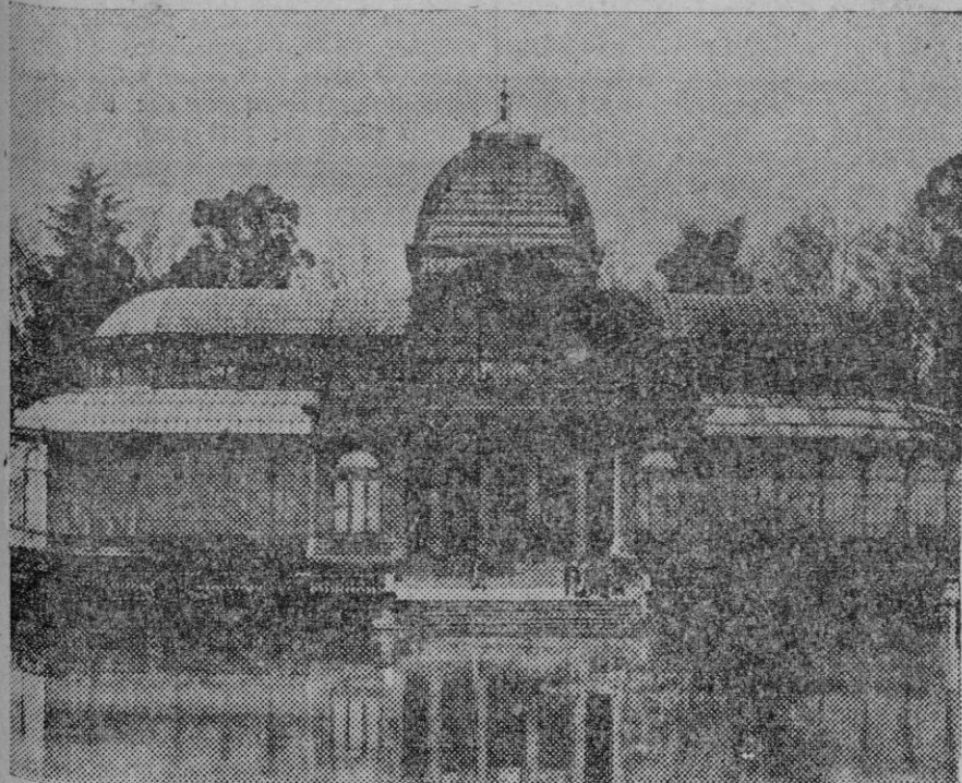
El Palacio del Retiro de Madrid, donde se reunirá la Asamblea para elegir al nuevo Presidente de la República.