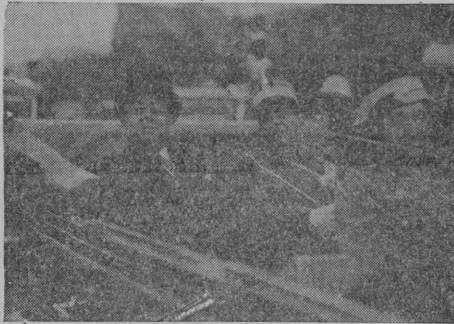
El Presidente interino de la República Sr. Martínez Barrio con el Ministro de la Guerra General Masquelet, revistando las tropas antes del desfile del 14 de Abril.

Ahora que está constituido el Parlamento y comienza éste a funcionar normalmente, es cuando llega la ocasión de que por nuestras Corporaciones, que recibieron aquellas promesas, las recuerden en la forma que estimen más oportuna, a fin de que cuanto antes vayan al Parlamento las leyes que nos fueron prometidas.