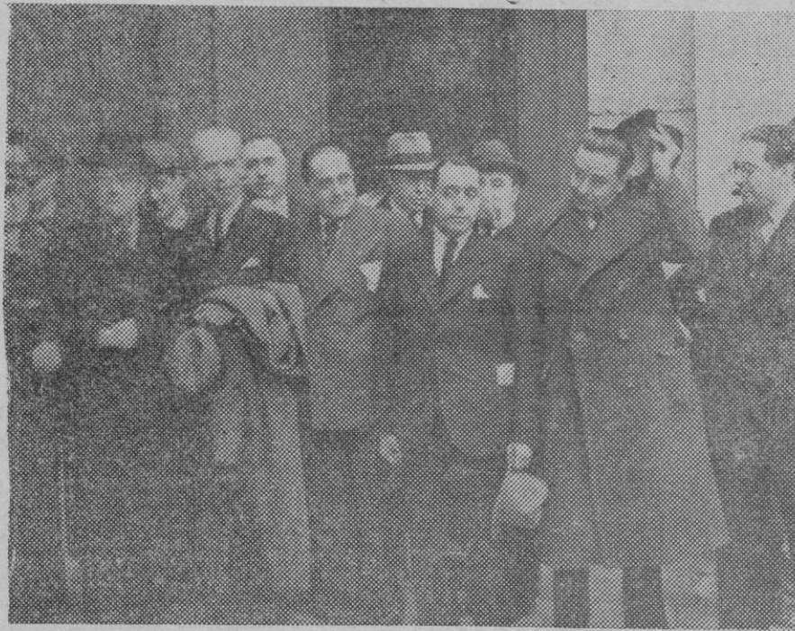
Grupo de diputados de Unión Republicana, saliendo del Palacio Nacional, después de cumplimentar al Sr. Martínez Barrio.

No somos ya las islas dormidas en el seno del mar Mediterráneo, sino un trozo vivo y palpante de la encarnadura española. Y es por eso que ya España se demuestra en favor de Mallorca, porque España ha realizado el hallazgo de algo intensamente español, de algo que ella ignoraba, y que, por conocerlo, le cautivó el corazón.