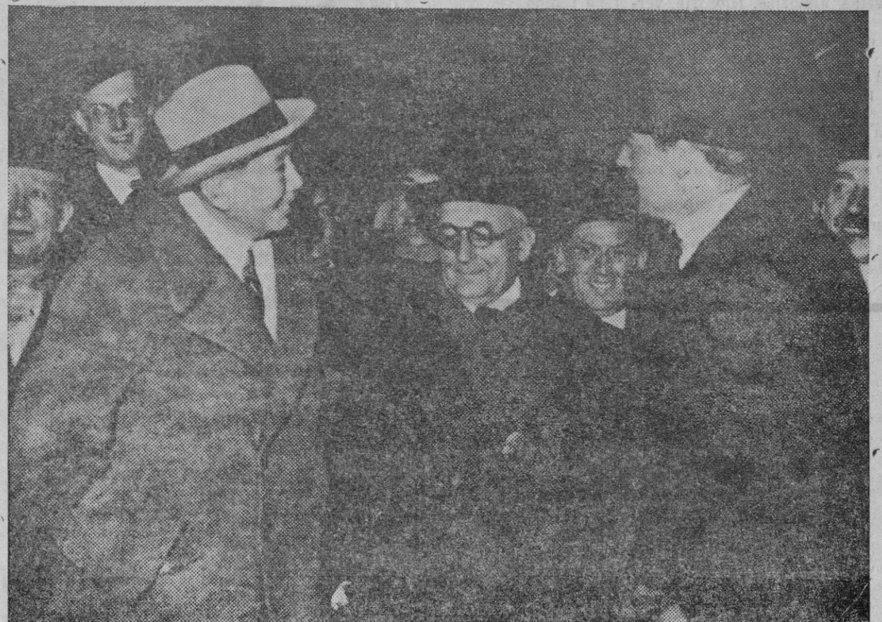
Los Sres. Titulesco (Rumania), Madariaga (España) y Eden (Inglaterra), a su salida de la estación de Lyon de París, para dirigirse a Ginebra.