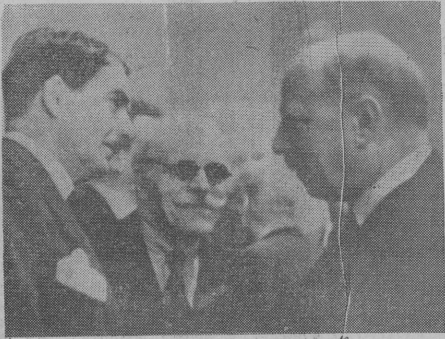
El Ministro de Relaciones Extranjeras inglés Mr. Eden, comentando en los pasillos de la Sociedad de Naciones la marcha de las gestiones para la paz italo-abisina.

Y si su propósito es firme, ¿por qué en lugar de preocuparse por esos mercadillos que en interés de Palma deben cuanto antes desaparecer, no se deciden a poner sobre el tapete el proyecto del nuevo mercado?