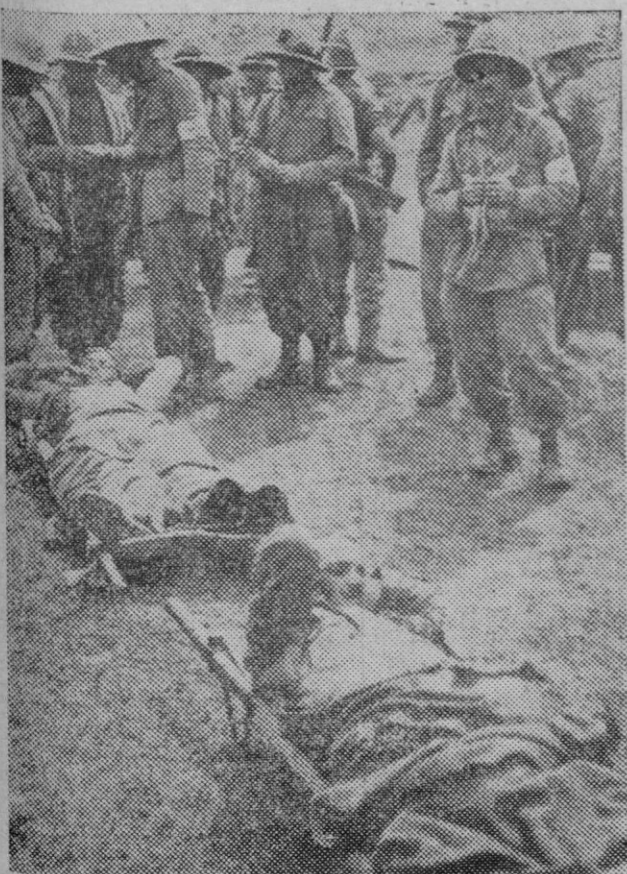
Llegada a los campamentos italianos de los primeros heridos en la batalla de Amba Alhagui.

Hay algunas gentes que creen en la unión más o menos remota de la izquierda republicana y unión republicana con los cedistas y agrarios — estos tienen 12. Fundamentan su so-