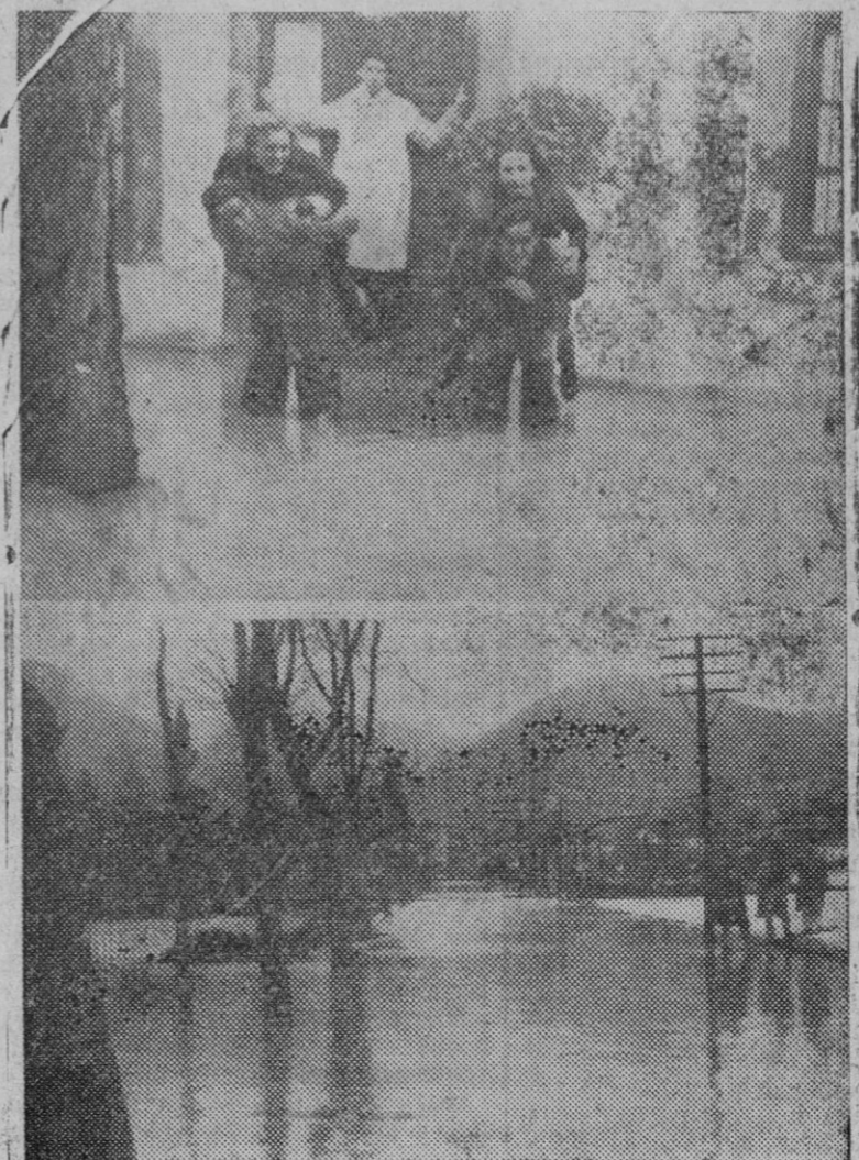
Dos aspectos de las inundaciones que se han registrado en Vizcaya, tomados en un pueblo de los alrededores de Vizcaya. (Express Foto).