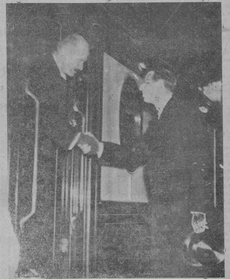
El Duque de Kent despide en Londres al Presidente de la República Francesa, Mr. Lebrin, al regresar éste a su país después de asistir a los funerales de Jorge V.