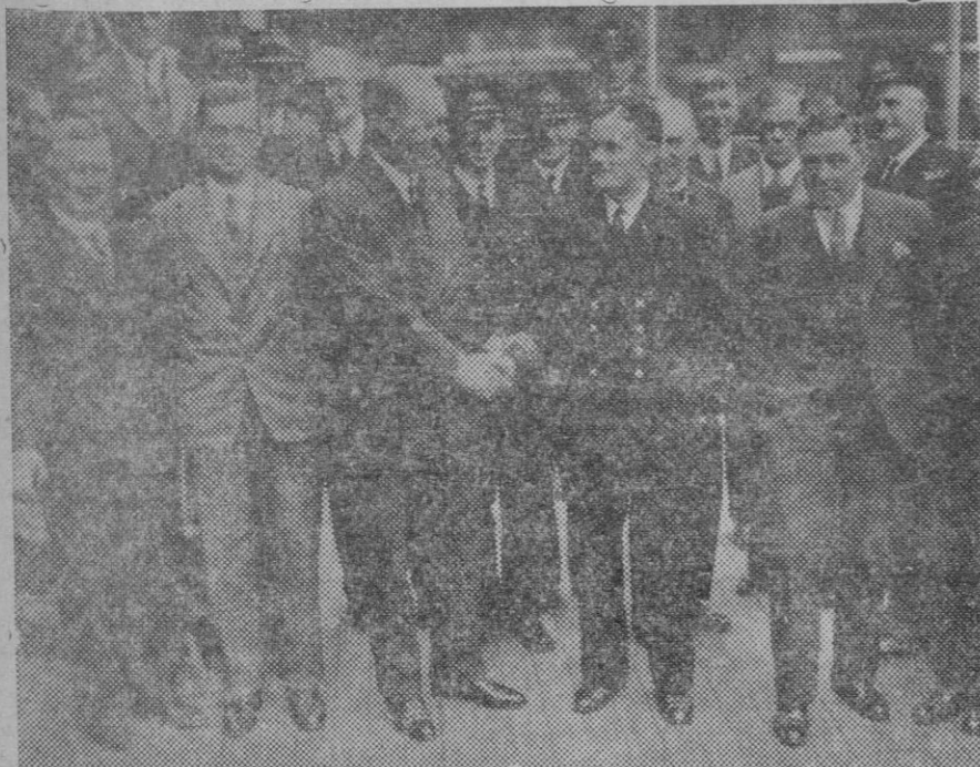
El Capitán y oficiales del "Discovery II", que han logrado salvar a los aviadores Ellsworth y Keynon, perdidos hacia varias semanas en los mares antárticos.

Y si como dicen algunos que se consideran maestros de la vida, nues