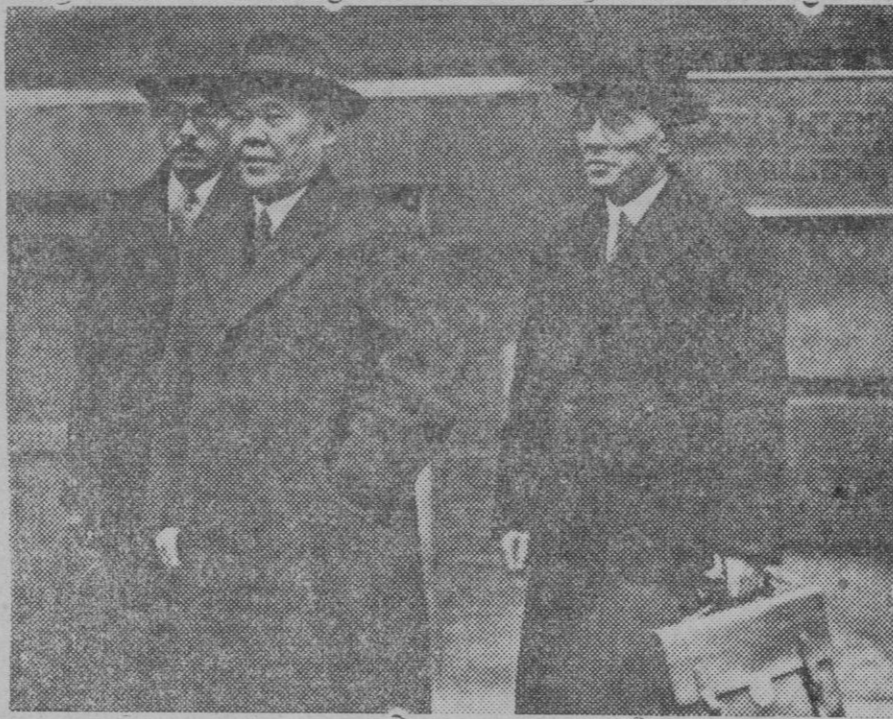
La Delegación japonesa que se ha retirado de la Conferencia Naval de Londres.