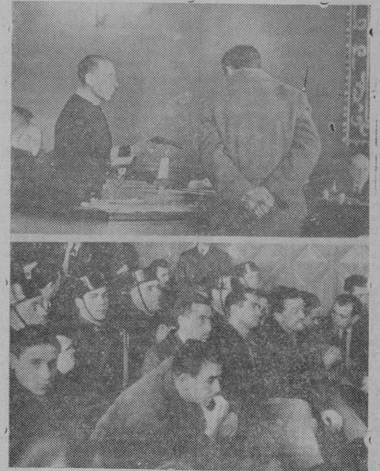
Vista de la causa por el atraco al Ayuntamiento de Madrid. Dos aspectos del acto.

Aun está por hacer la legislación capaz de impedir el fraude, la mala fe y el abuso en todas las relaciones económicas. Los códigos actuales ya no sirven, se han quedado anticua-