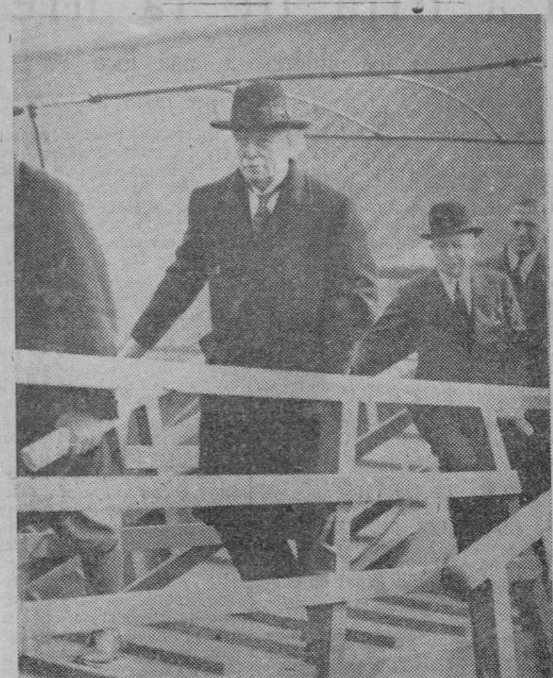
El ex-Primer Ministro inglés David Lloyd George, embarcando en el puerto de Tilbury (Inglaterra) para Tánger, donde permanecerá una temporada escribiendo sus «Memorias».

un hombre, una conducta, una doctrina última obra de EL CABALLERO AUDAZ 6 ptas. ejemplar venta en la librería José Tous.