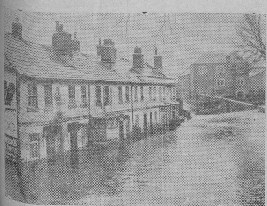
Diversas localidades del suroeste de Inglaterra han sufrido inundaciones a causa de la lluvia. Aspecto de las calles de Tonbridge.

Transitábamos nosotros por estas imaginadas calles, llevados de una necesidad indispensable cuando nos encontramos a otro amigo acompañado de una linda muchacha. ¿Que haces por aquí, en lugar tan inhospitalario? A lo que nos repuso que habiendo surgido la conversación entre él y su novia de como el abandono de Madrid era notorio, la había invitado a