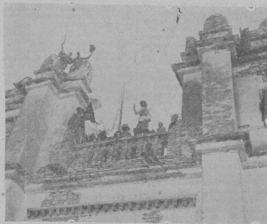
Momento de ser izado el pabellón italiano en la fortaleza de Marcalé, al ser tomada la ciudad.

Por justicia, por conveniencia pública y por respeto a los ciudadanos, entendemos que debe ser suprimido el odioso y odiado impuesto que pesa sobre las necesidades del vecindario.