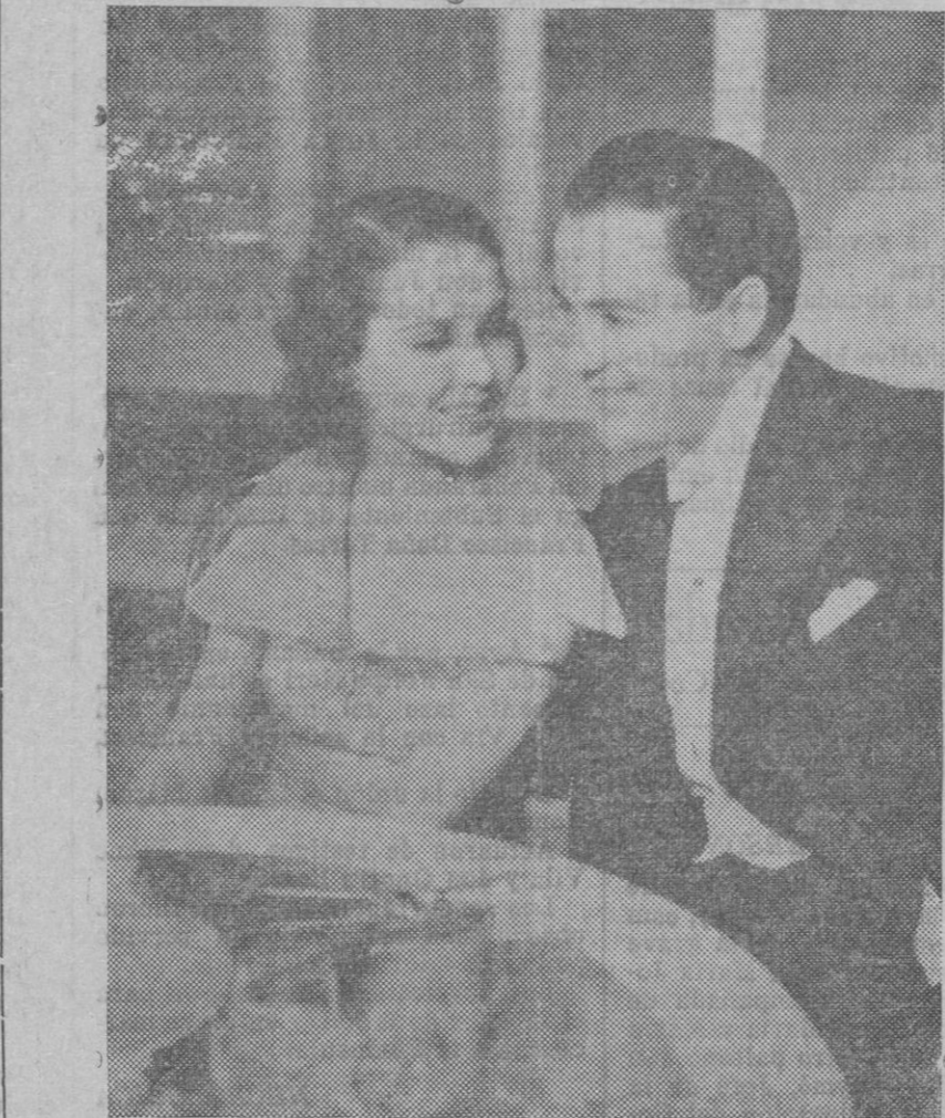
En breve se celebrará en Hollywood el matrimonial enlace de la conocida estrella de la pantalla Mary Brian, con el no menos conocido as Charles Rogers. Los novios en un restaurant de Hollywood.