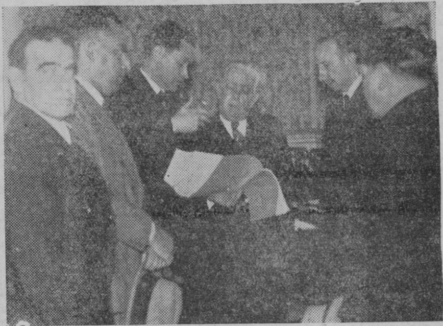
La comisión bilbaína que visitó al Sr. Chapaprieta, para interesarse por las obras del ferrocarril Aretas-Tres Padarnes.

Y a ello ha de tender la autoridad y en interés público, debemos alentarla a ello.