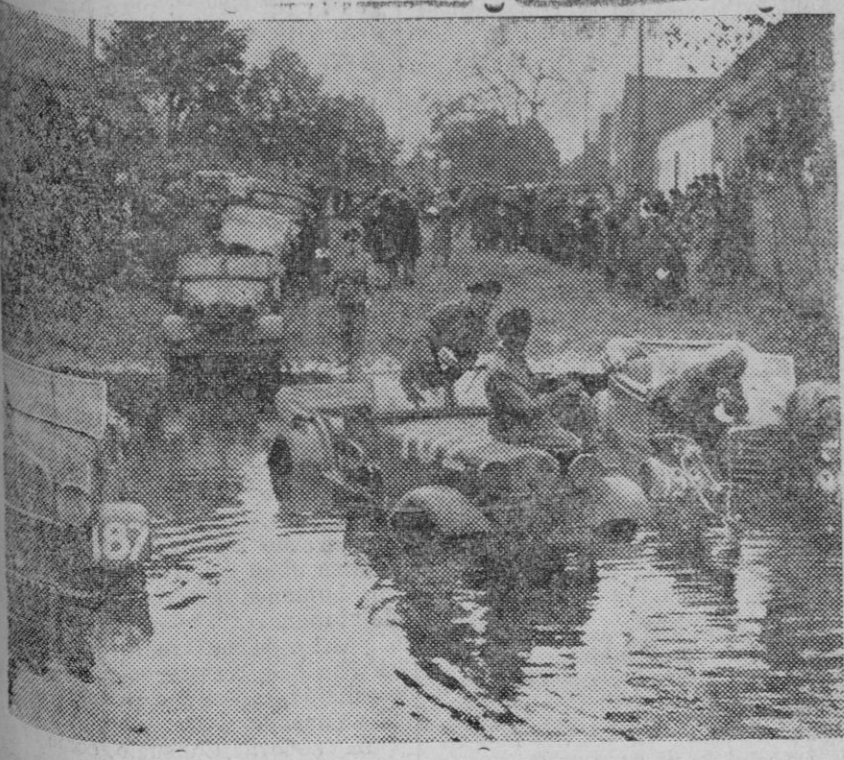
Una de las pruebas automovilistas más difíciles que se organizan en el mundo es la Vuelta de Brandeburgo, en Alemania. He aquí a los participantes en la prueba al llegar al Bosque de Spré.