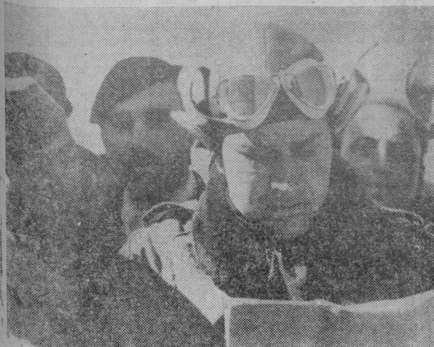
El Conde Ciano, yerno de Mussolini, que como aviador toma parte en la campaña de Abisinia.