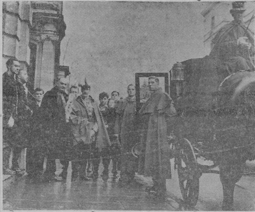
Llegada del Embajador de Chile en Inglaterra, al palacio de Buckingham, para presentar al soberano inglés sus cartas credenciales.

Ojalá la decisión que muestra la Corporación Municipal, se convierta en un empeño positivo de iniciar pronto las obras en proyecto.