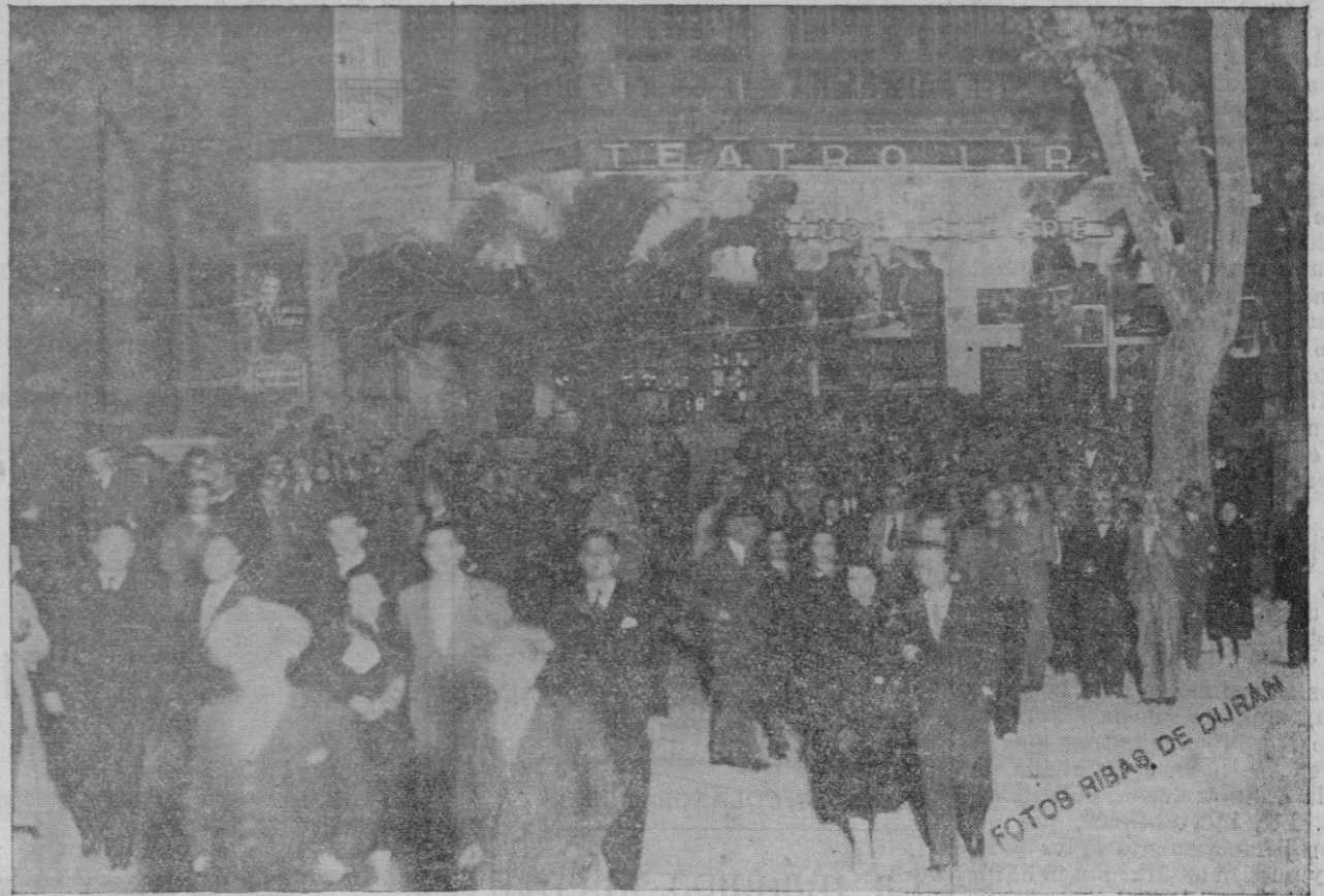
EL EXITO DE UNA PELICULA. — He aquí una prueba palmaria del interés extraordinario que despertó en nuestra ciudad el estreno de la gran producción de la Metro «La Viuda Alegre». Véase esta fotografía, que muestra la enorme avalancha de público saliendo del Teatro Lírico al terminar ayer una de las sesiones.