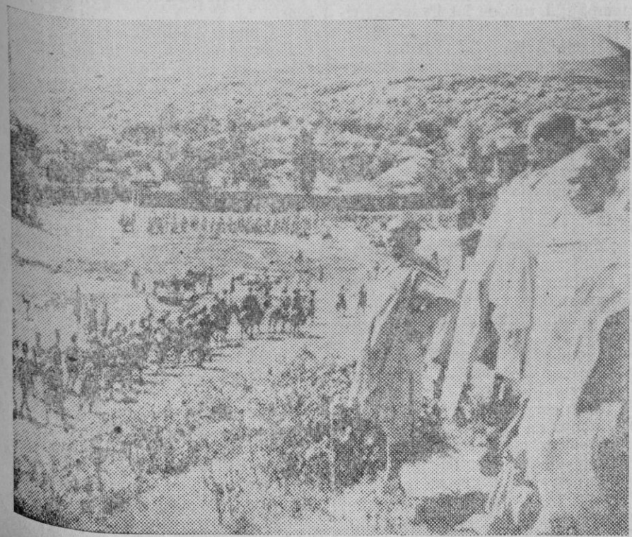
Indígenas de Askum presenciando cuando las tropas italianas...