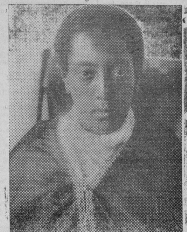
Lidsch Jassu, pretendiente al trono de Abisinia, que ha sido llevado a Gaza Muntera, cerca de Ha-