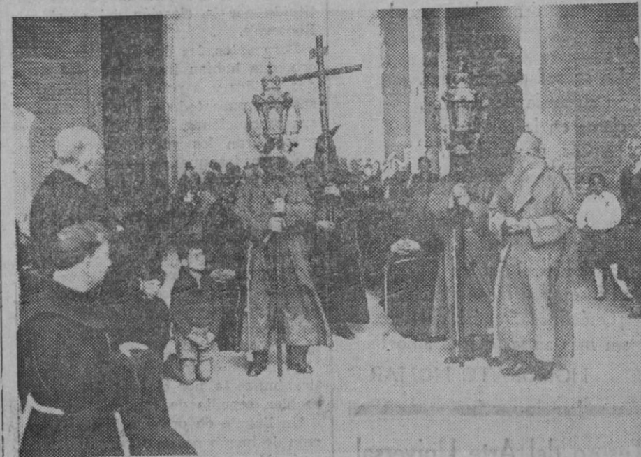
La procesión anual de los «Hermanos de la Buena Muerte» ha tenido lugar en Roma con una ceremonia en el Coliseo. Los «Hermanos de la Buena Muerte» se arrodillan a la entrada del Coliseo..