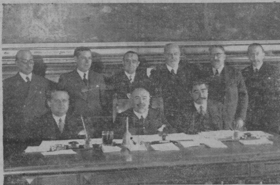
DE MADRID. — La reunión de la Comisión Permanente de las Cortes ha sido aplazada nuevamente por falta de número. Véase a los señores que asistieron a la reunión.