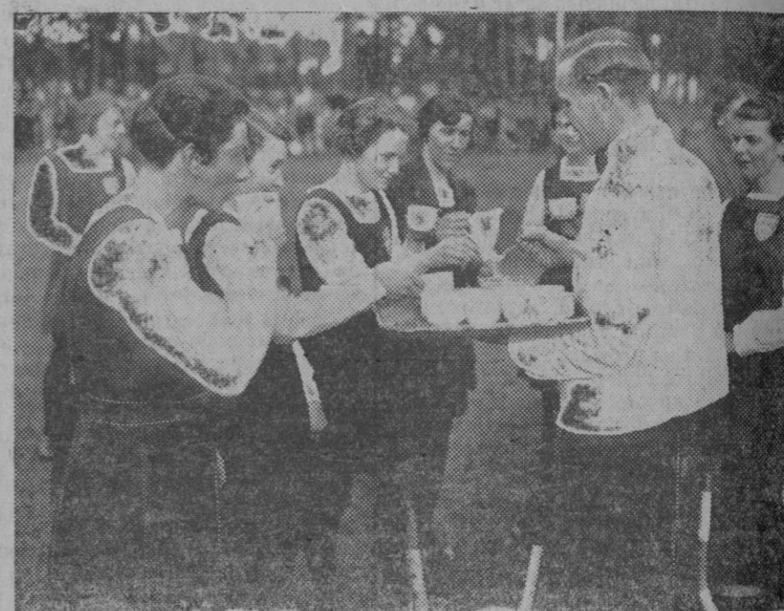
Aumenta cada día en la n rjer la afición al deporte, al extremo de que ya muy amenudo se des' plazan equipos femeninos para luchar campeonatos internacionales. Ahora se disputa en Alemania uno de Hockey, y ahí están las ingieras en un descanso del partido.