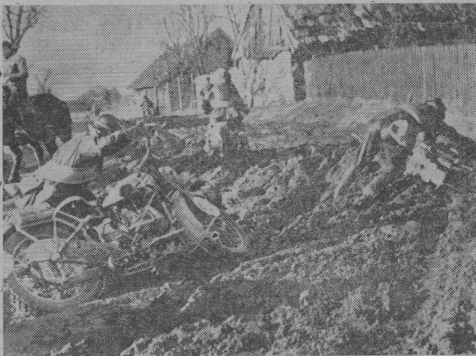
También el tercer día de la gran carrera de motocicletas fué penoso; caminos difíciles fueron la causa de varios fracasos. A causa del barro que cubre los caminos es difícil seguir con las motocicletas