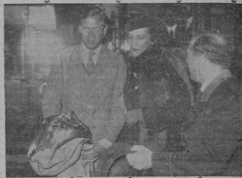
Procedentes de San Sebastián acaban de llegar a París los duques de Kent. La pareja real bajando del vagón en la gare D'Orsay.