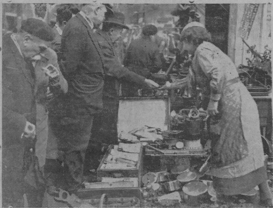
Cada año tiene lugar en París la pintoresca feria de los Jamones y ferretería en el Boulevard Richar d-Lenoir. Un puesto de objetos b...