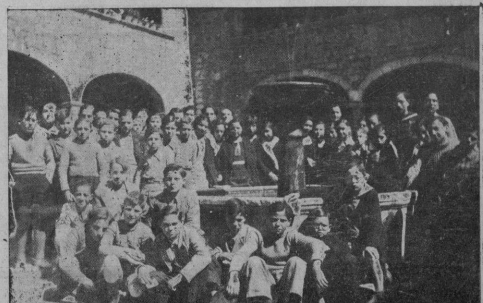
Los alumnos del Instituto de Segunda Enseñanza de Inca, que realizaron una excursión a «Son Torrella»