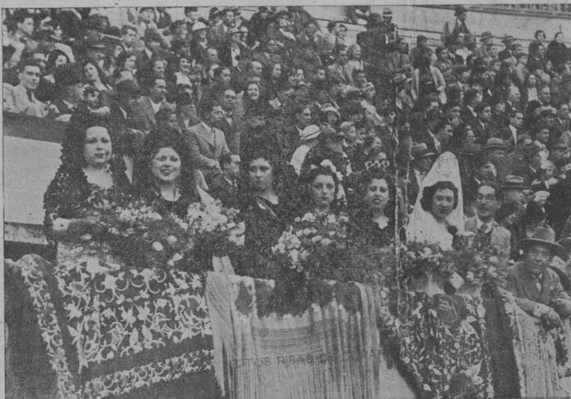
«Miss Comercio 1935» con su corte de honor, que presidió la no villada celebrada ayer tarde.

Es de todo punto preciso interesarse en favor de nuestra justa aspiración al nuevo Ministro de Obras Públicas, ante quien estimamos deberían reiterarse las gestiones hechas cerca de su antecesor.