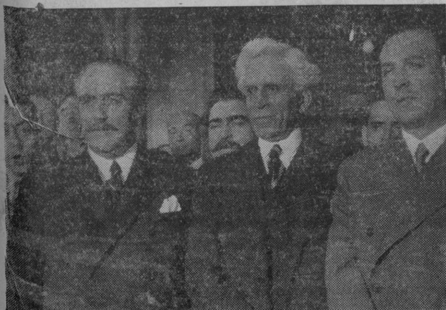
Toma de posesión del nuevo ministro de la Gobernación señor Portela Valladares.