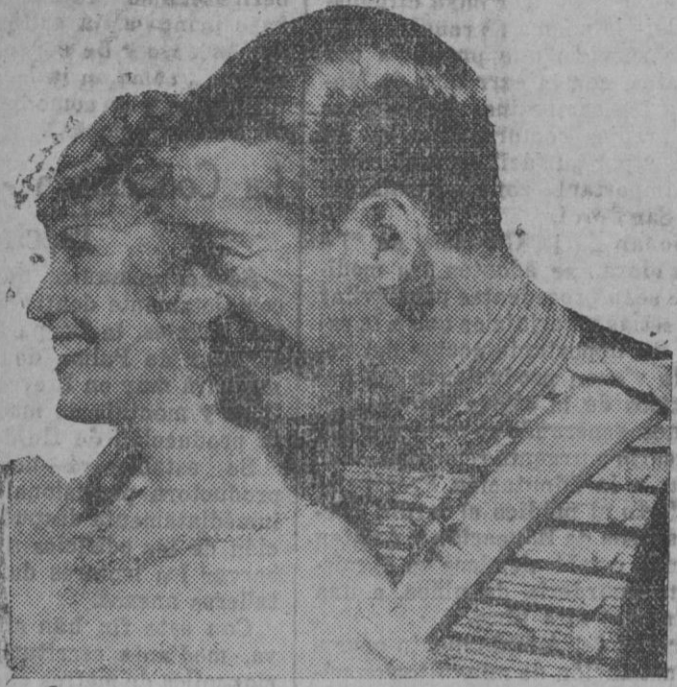
Los triunfadores en «El desfile del amor» aquel film que se hizo tenario en los programas, vuelven por otro éxito semejante con «La viuda alegre», protagonizados igualmente por Jeanette Mac Donald y Mauricio Chevalier