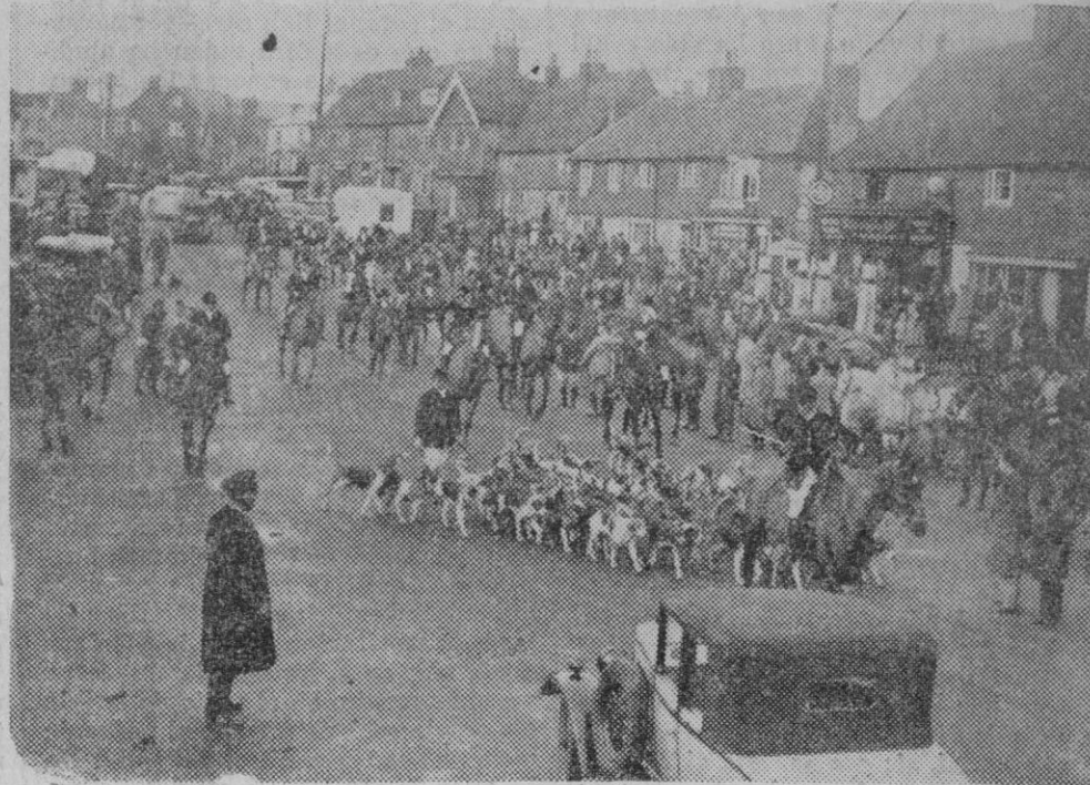
LAS CLASICAS CACERIAS INGLESAS.—Una pintoresca escena, tomada en Bletchingley, durante una clásica cacería inglesa. Las chaquetas rojas, las jaurías compuestas por los mejores perros de Surrey y Burstow, las trompas de caza, todo contribuye a dar a estas famosas cacerías, un sello de rancio romanticismo y de señorial elegancia.