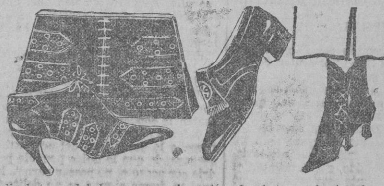
La media bota y el boleto, se armonizan para su frecuente uso.