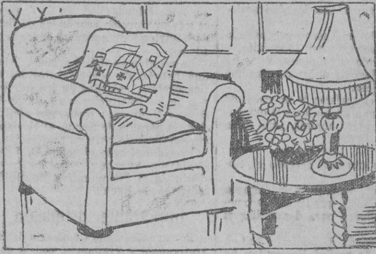
Los cojines se bordean de un solo tono, representando galeones.

No solamente se limita el bordado del galeón a los cojines. Su aplicación alcanza a los caminos de mesa, al mantel, al apañador, al saco de labor.