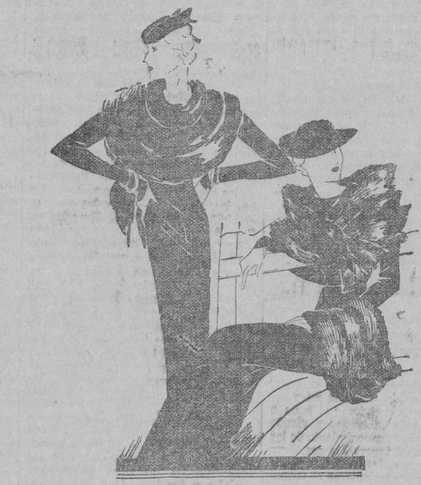
A los trajes de negro, se les agrega cuello de renard formando tres bandas

En los pequeños detalles, los ropas, se muestran libres de toda ternura embarazosa, porque se deja sitio a lo proplamente sencillo y neto. La fi-