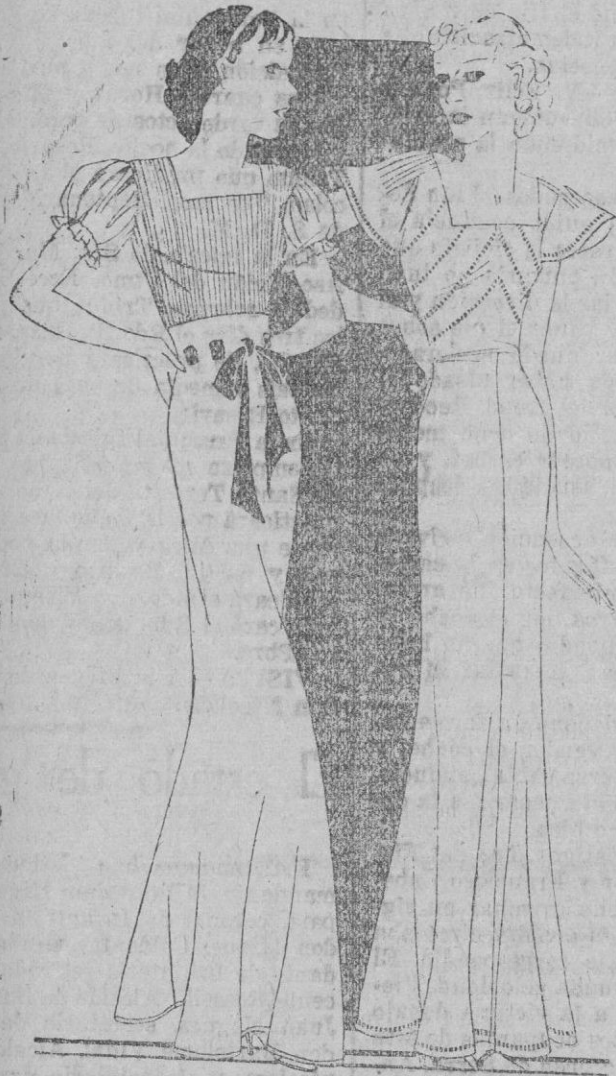
En la incertidumbre, el blanco ha dejado sitio al rosa y al verde.

Cambian las costumbres y se modifican también los gustos. Aquellos tiempos de la ropa blanca, se fueron. Hoy son los coloridos diversos más usuales y más en boga. El rosa y el verde pálido presiden la sinfonía de las predilecciones. Con esos tonos, se componen pijamas, camisetas de noche y en fin cuanto es inherente al atavío interior. En rosa pálido es la original camisa