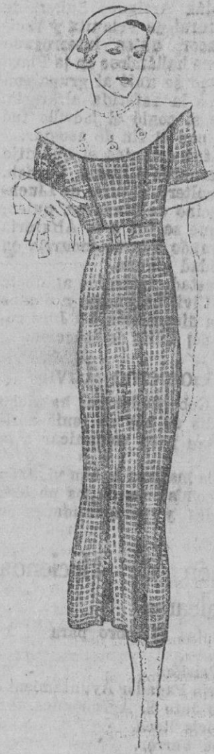
Toma el nombre de Joseph Paquin, y está hecho en tejido de lana y seda, en fantasía tricolor. El alto de la chaqueta forma cuello marino, aumentado con otro cuello encima en piqué blanco. El cierre del cinturón, lo constituyen las iniciales de un nombre y apellido.

Llega a nosotros en momentos de tribulación y de economías. Al nuevo establecimiento puede ser, si la selección de los artículos responde a un propósito de novedad y la eficacia de los usos de cada uno de ellos es práctica, barata y conveniente, base de una excelente actuación.