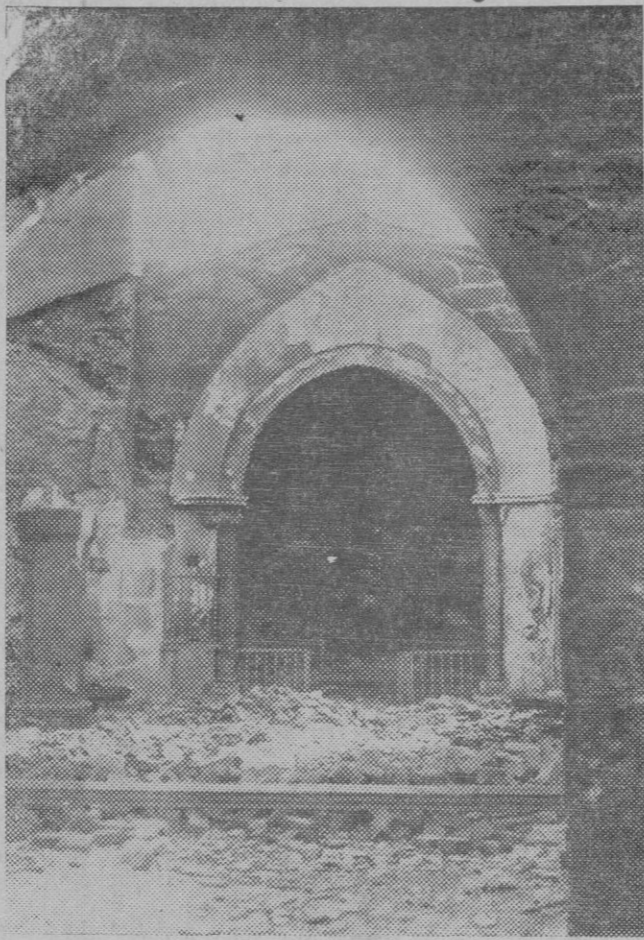
LOS SUCESOS DE ASTURIAS. — La Iglesia del Pueblo de Baruelo incendiada y totalmente destruída por los revoltosos.

Al condenar tales hechos y significar nuestra adhesión al régimen que con tanta energía ha sabido defender el Gobierno, confiados en que la serenidad presidirá su obra y aun la informará en los más elevados sentimientos de clemencia para los que fueron arrastrados por una desheredada locura, anhelamos que España reempreda con plena normalidad, dentro de los principios del régimen liberal y democrático que conquistó, su marcha hacia la prosperidad y el progreso, suprema aspiración de todo buen ciudadano.