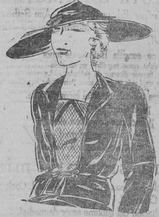
Sugestiva perspectiva de un bello atavío cuya confección señala el mandato del tipo sastre. Una blusa interior, hecha de viejos pañuelos aclara y pone el contraste en el conjunto del traje.

Aunque la obediencia de la moda nos indica como prodilecto el negro, también el azul marino se ajusta con perfección a aquella demanda.