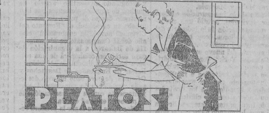
Las doradas con relleno al horno, una excelente vianda.