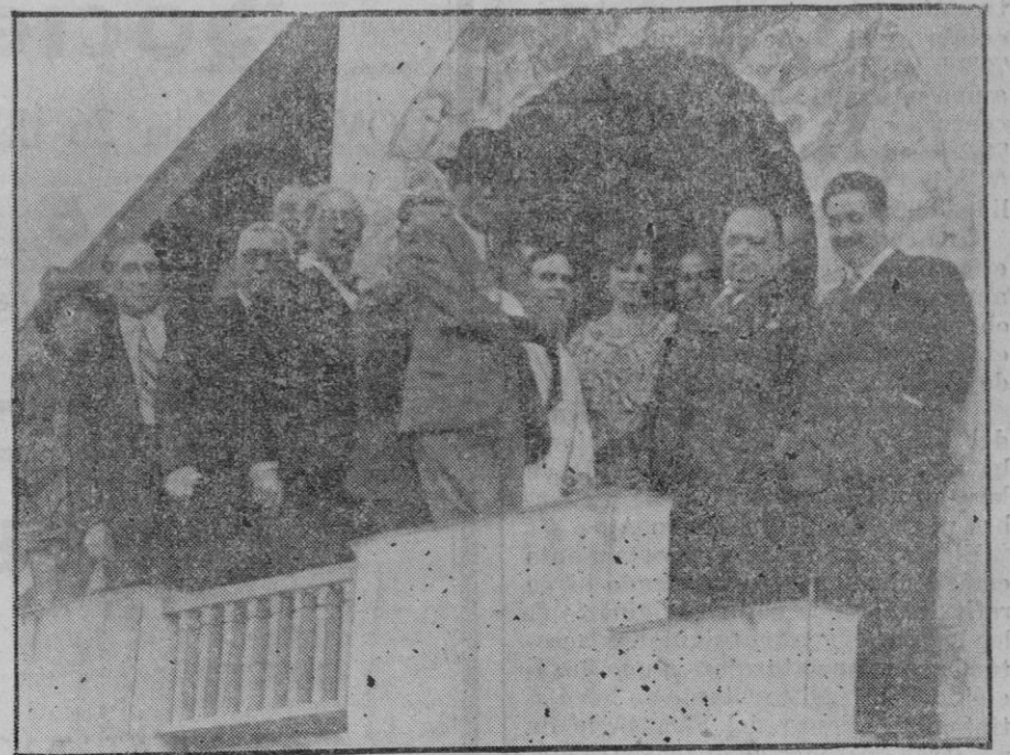
INAUGURACION OFICIAL.—El ministro de la Gobernación y el Alcalde de Madrid, en la Ciudad Jardín de Prensa y Bellas Artes, con motivo de la inauguración de las Obras de Sanidad y Urbanización.

De pronto estalla brutalmente la horrenda discordia: cae asesinado el