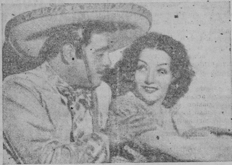
Dos compatriotas, Lupe Vélez y Leo Carrillo, en una escena de su nueva película sobre ambiente mejicano.