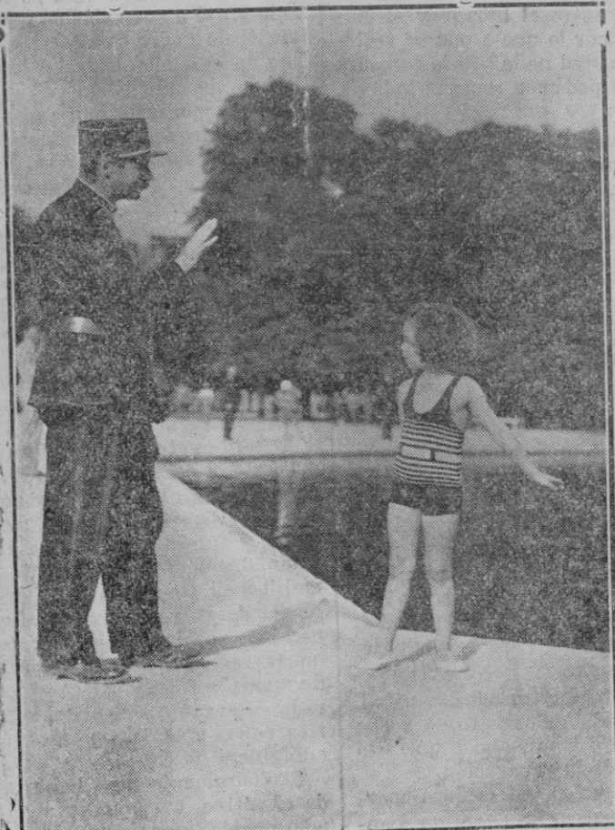
PARIS. — Un guardia de la paz prohibiendo a una pequeña bañista bañarse en el estanque de las Tullerías