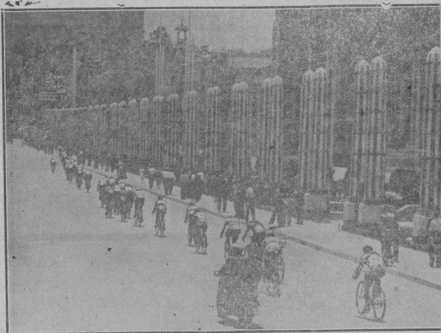
LA VUELTA CICLISTA A CATALUÑA. — Llegada de los corredores. El pelotón de cabeza subiendo por la gran Avenida de la Exposición hasta el Estadio, meta definitiva de llegada.

Por ello nos es grato aplaudir sin reservas la disposición del Gobierno accediendo a lo que habían solicitado los fabricantes de calzado, y aplaudir la gestión de nuestros Diputados que tan eficazmente han apoyado aquella gestión.