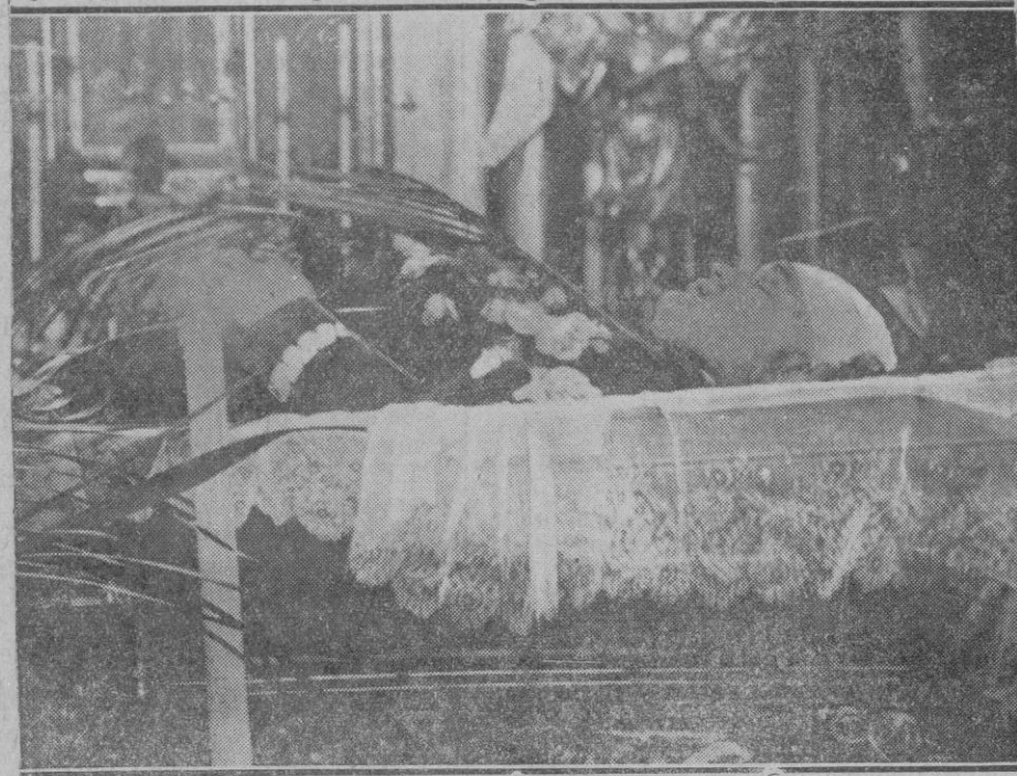
DEL ASESINATO DEL MINISTRO DEL INTERIOR DE POLONIA. — El cadáver del ministro polonés Bronislaw Pieracki, asesinado a tiros de revólver, expuesto al público en la Iglesia de la Sta. Cruz de Varsovia

Como antes hemos dicho seríamos injustos si no reconociéramos que el Ayuntamiento viene prestando, por lo que a la limpieza de la vía pública y riego de la misma se refiere, una mayor atención que antes, atendiendo muchas de las quejas que la prensa ha recogido señalando deficiencias, en particular del servicio de riego, el cual estos meses ha de intensificarse lo más posible, no regateando para ello el Ayuntamiento esfuerzo alguno, en particular en el Ensanche, donde por ser los pisos de terriso, el polvo constituye una verdadera pesadilla para los vecinos. Una racha de viento, o simplemente el paso de un coche a alguna velocidad, levanta verdaderas nubes de polvo, obligando a los vecinos a cerrar las puertas para que el polvo no invada las viviendas, lo cual en esta época resulta una molestia intolerable.