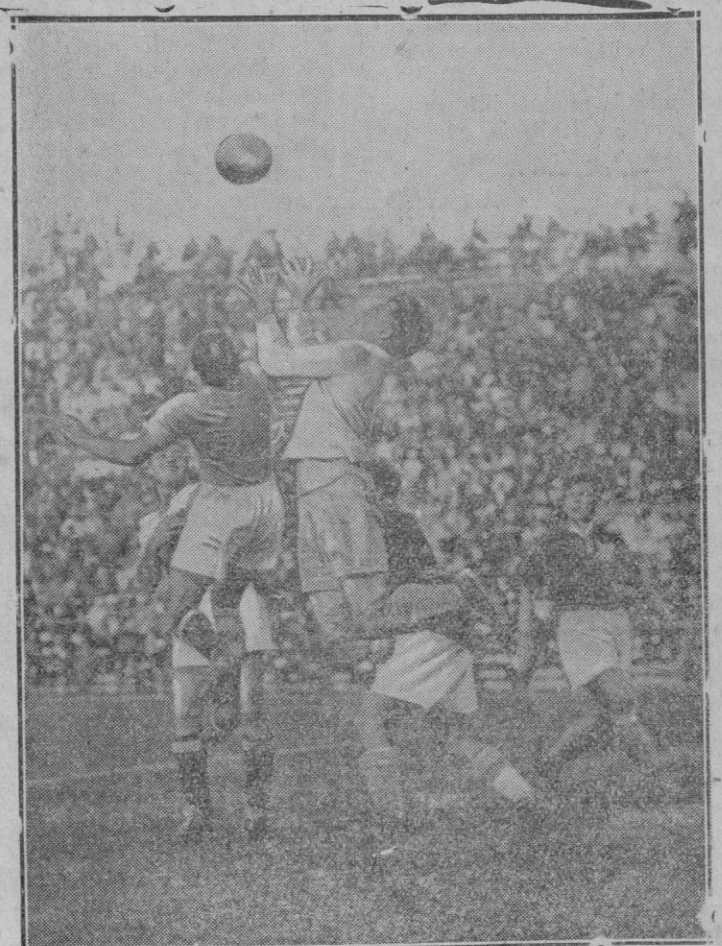
ITALIA.—Final de la segunda copa del mundo de fútbol terminada con la victoria del Italia.—Después de un partido muy igualado el equipo de Italia consigue batir al once de Checoslovaquia por 2 goals a 1.—Fotografía de una fase del partido que nos muestra el ardor con que se llevó la lucha.

Por tanto, nos hallamos ante un problema delicado y de difícil solución, por ser muchos los millones que se necesitan para poder llevar a cabo la gran reorganización que todo ello requiere, solo teniendo en cuenta el aspecto defensivo de las costas españolas, que, como se habrá podido advertir, están actualmente poco menos que desamparadas ante cualquier conflagración que pudiera originarse. Y