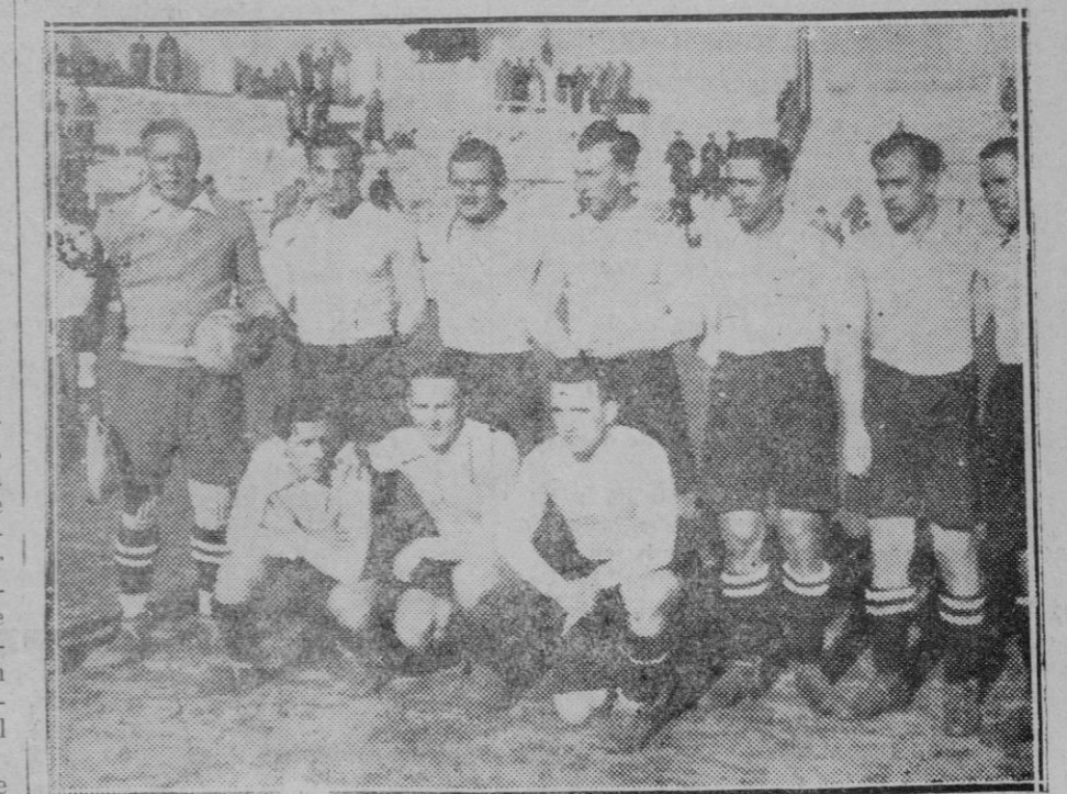
El equipo Nacional que jugará contra el Portugués para el campeonato del mundo

XII, la iluminación más fantástica lucía en el palacio del marqués de Campo.