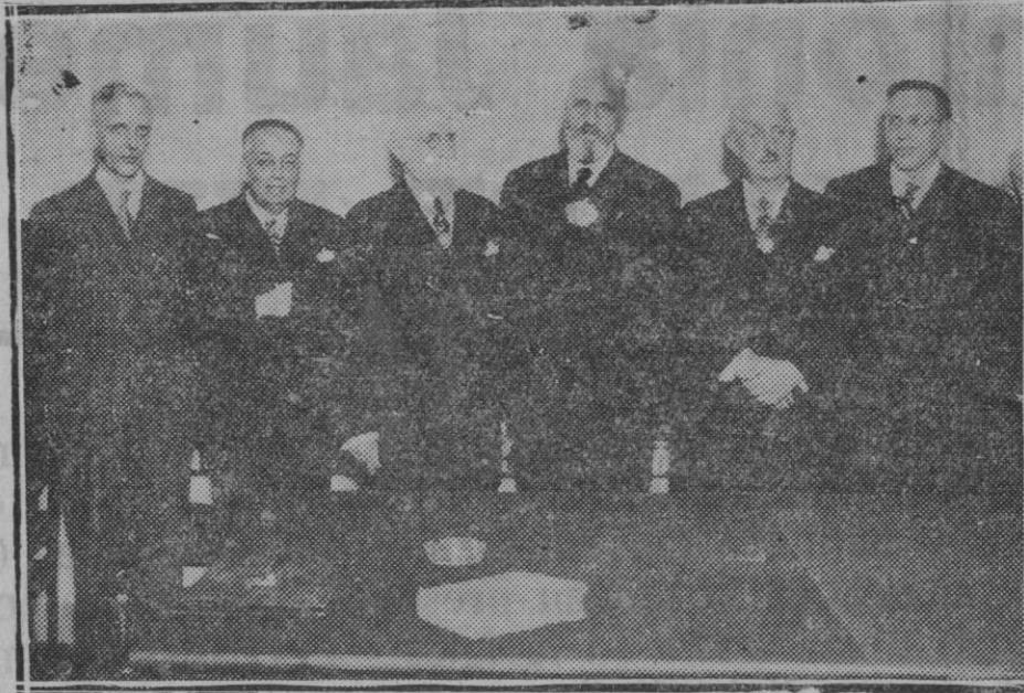
MADRID.—Academia de Ciencias Exactas Físicas y Naturales. Inauguración del curso 1933.

Sin embargo... El primer ataque a fondo dirigido a la política monetaria de Roosevelt de parte de influyentes hombres de negocios, fabricantes y banqueros, quienes hasta ahora sólo habían hecho su labor de crítica dura en "petit comité", se