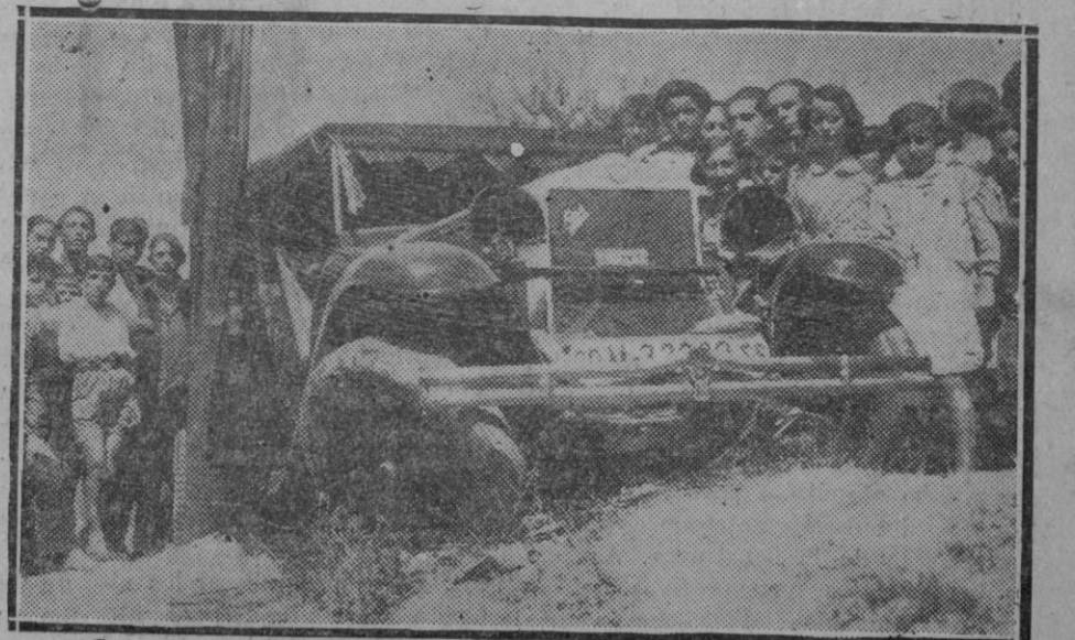
MIRANDA DE EBRO.— Estado en que quedó el automóvil ocupado por el Nuncio de Su Santidad, monseñor Tedeschini después del grave accidente en que dicho señor resultó lesionado.

En las grandes capitales la cuestión es más sencilla porque la iniciativa privada sustituirá gran parte de las escuelas, y por que en ellas, por muchas escuelas que se creen, nunca habrá exceso. En los pueblos,