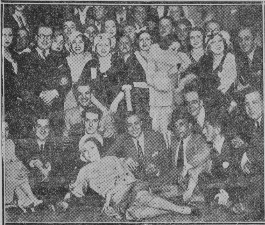
MADRID.— Los autores e intérpretes de la revista «Gol» reunidos en fraternal despedida

Una vez más requerimos esta reorganización que tan fundamentalmente viene reclamando el vecindario, y que no puede ser negada sin que ello suponga un desinterés que sería injustificable, ante la comodidad del vecindario.