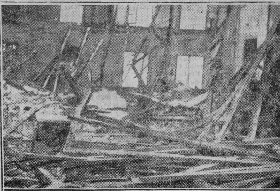
MADRID.—El incendio de los talleres de carpintería en Tetuán de las Victorias. — En la foto el taller después del siniestro completamente carbonizado y destruido.

En cambio de esta generosa utopía, surge la anárquica libertad de emitir monedas por organismos que no tienen la responsabilidad de los Estados ni las garantías que ofrecen los bancos nacionales. El scrip con que han hecho pagos y transacciones algunos municipios, bancos y grandes industriales norteamericanos es, sin duda ninguna, una moneda ilegítima que puede producir mayores estragos, si se genera-