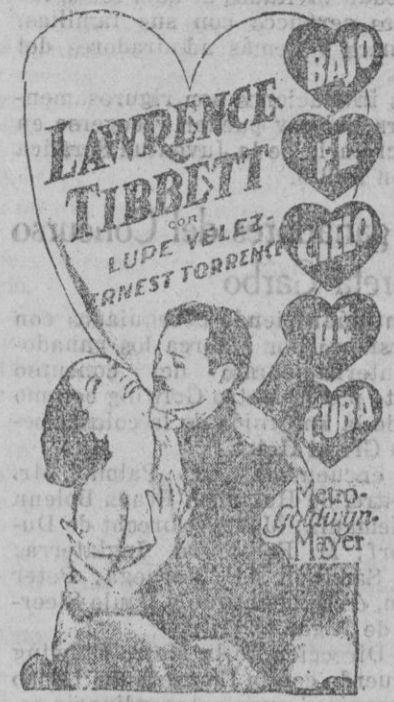
LOS GRANDES FILMS