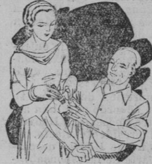
Dolor en las articulaciones Calambres

No ocupa sitio Desconggestion sin irritar No ensucia No tiene mal olor