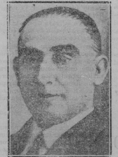
Martínez de Velasco, defensor del General Aizpuru