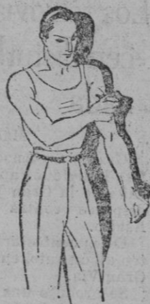
Fatiga muscular Golpes-Torceduras