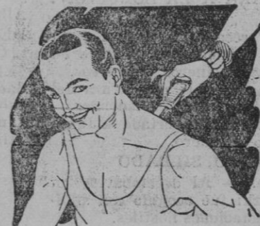
Rigidez del cuello Torticolis