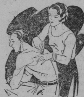
Artrismo Dolores de muñeca y brazos Dolores de espalda y riñones

El LAPIZ TERMOSAN se vende en todas las Farmacias y Centros de Especificos Tubo grande; 4.45 ptas. - Tubo pequeño; 3. - ptas., timbres incluidos