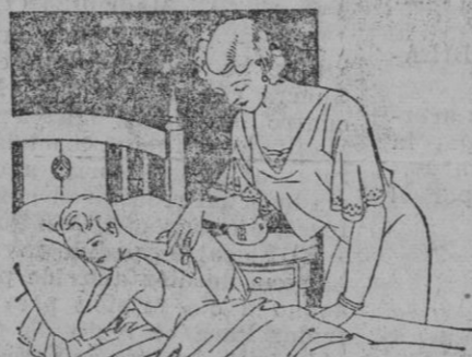
Resfriados - Asma - Pleuresias Congestión pulmonar