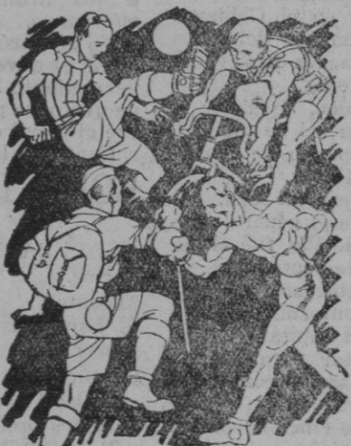
Indispensable para toda clase de sports. No ocupa sitio ni es frágil