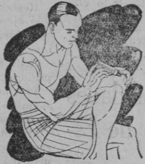
Reuma - Clática Golpes

Preparado en forma de una barrita de facilísimo empleo. Se aplica rápidamente tal como se presenta y sin tener que ensuciar-se las manos.