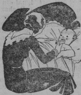
Tos - Catarros - Bronquitis Congestiones