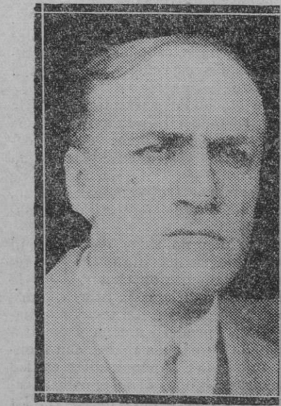
El maestro Lasalle recientemente fallecido en Madrid y cuya muerte se ha sentido mucho

¿Tiene la casa algún lujo o perfección que la distinga de las otras casas del pueblo? Fray Junípero Serra era un hijo de labradores; sus padres no poseían probablemente más bienes que los otros labradores del país. Los muebles son humildes, las estancias modestas. En la casa no faltaría nunca lo suficiente, gracias a