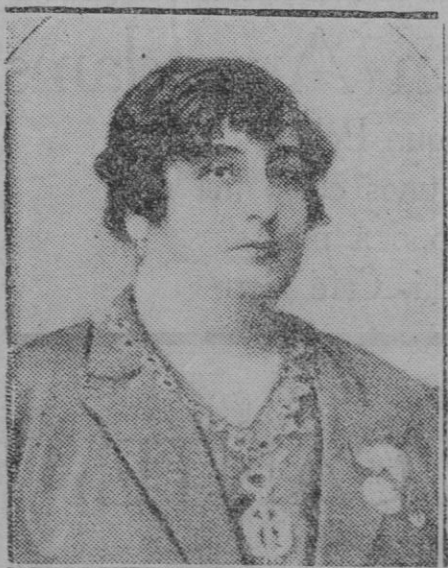
Ha fallecido recientemente en Madrid la ilustre escritora doña Carmen de Burgos