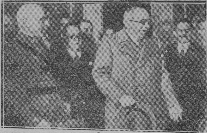
PALENCIA.—De las maniobras militares. El Presidente del Consejo de Ministros con las autoridades de Palencia, al llegar a dicha capital para dirigirse al campo de maniobras.

Como decimos al principio de este escrito, cuanto afecte a la comodidad de los vecinos debe merecer la atención de todos y en primer lugar por parte de la autoridad municipal.