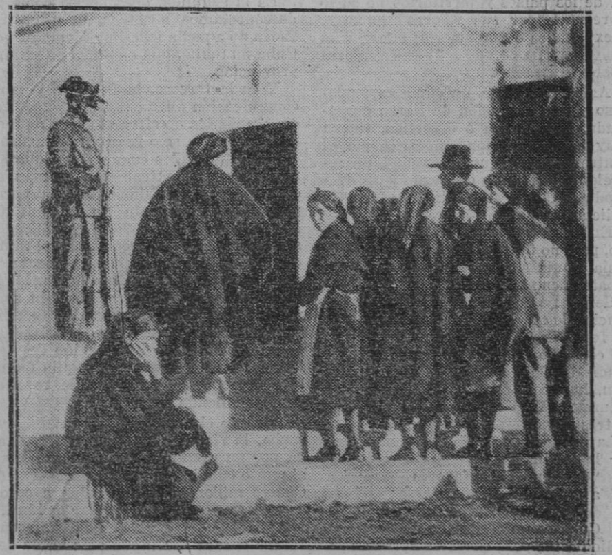
LOS GRAVES SUCESOS DE A NAYOMOLINES DE LEON.— Los revoltosos acosaron y desarmaron a cuatro guardias Civiles, a los que dejaron heridos. En la foto los familiares de los detenidos