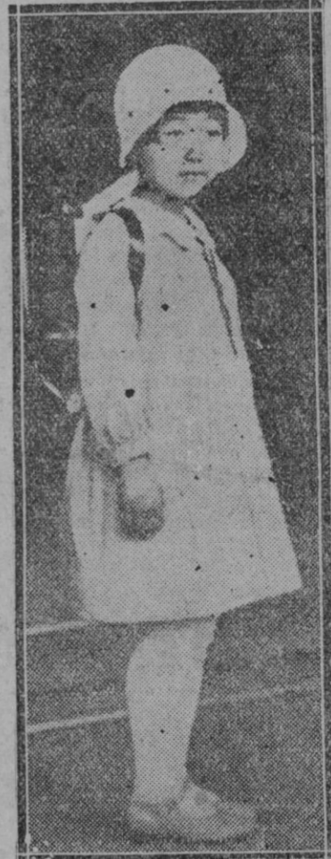
La Princesa Aeruko, hija del Mikado, retratada en el momento de ir por vez primera a la escuela en Tokio, llevando a la espalda la cartera con los libros

—La actuación del Sr. Lerroux, antes y después de su salida del Gobierno, tanto en sus silencios como en sus discursos, ¿ha respondido