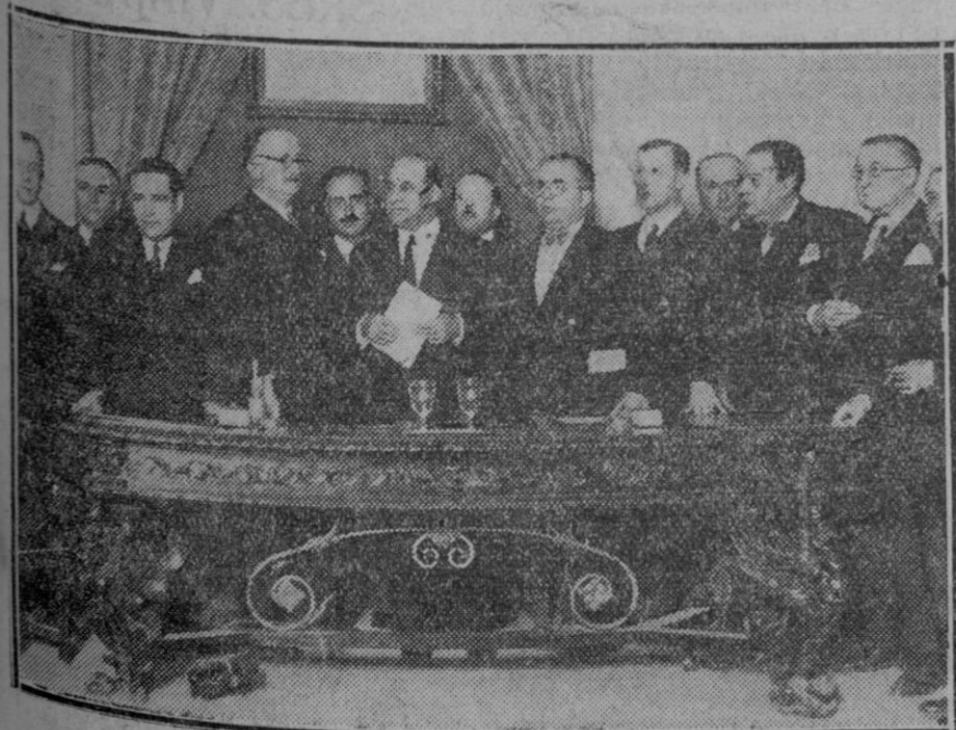
MADRID.—Toma de posesión de la nueva Junta directiva del Colegio de Médicos de Madrid