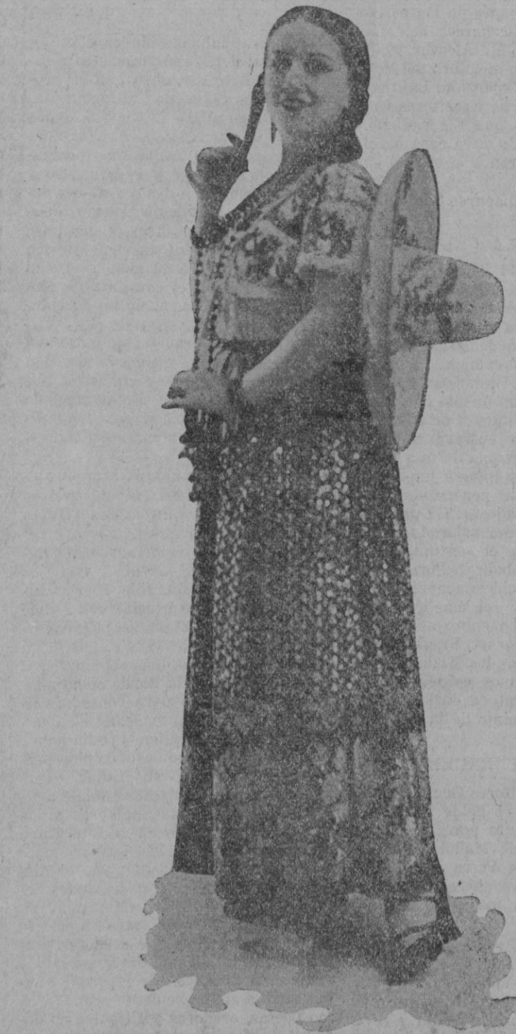
LUPE RIVAS CACHO

La famosa vedette que con su compañía mexicana debuta mañana en nuestro Teatro Lírico