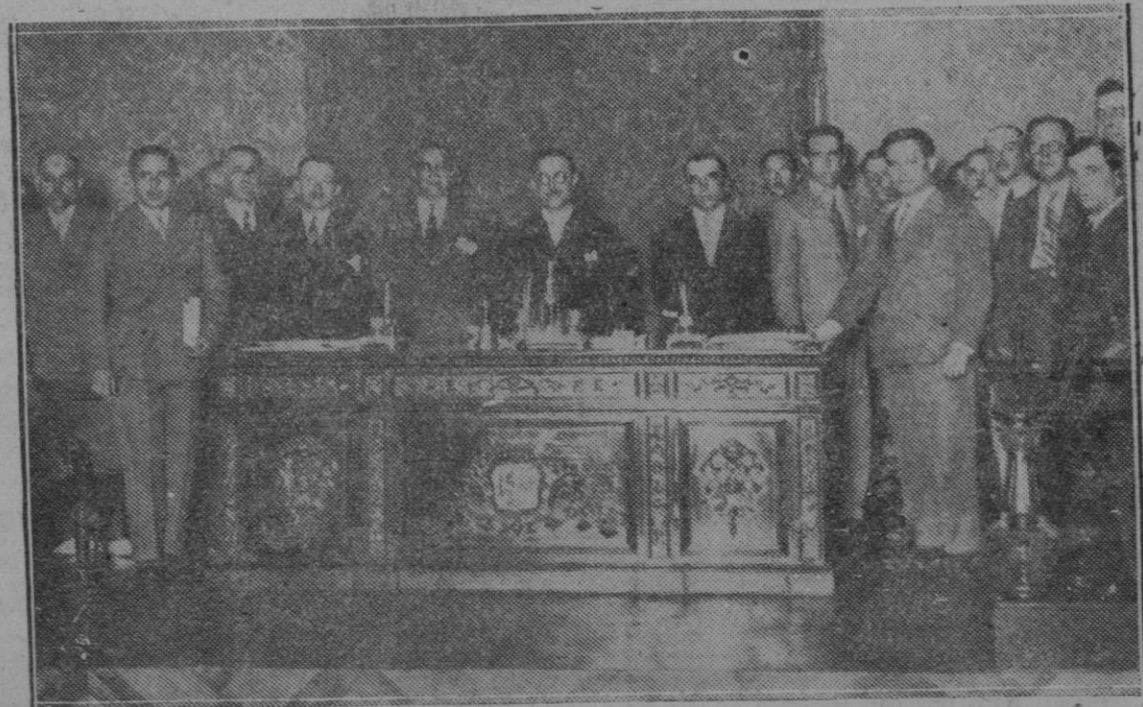
MADRID.—Diputación provincial.—Primer Congreso de Carteros urbanos de España presididos por el Director General de Correos don Alfredo Nistal.