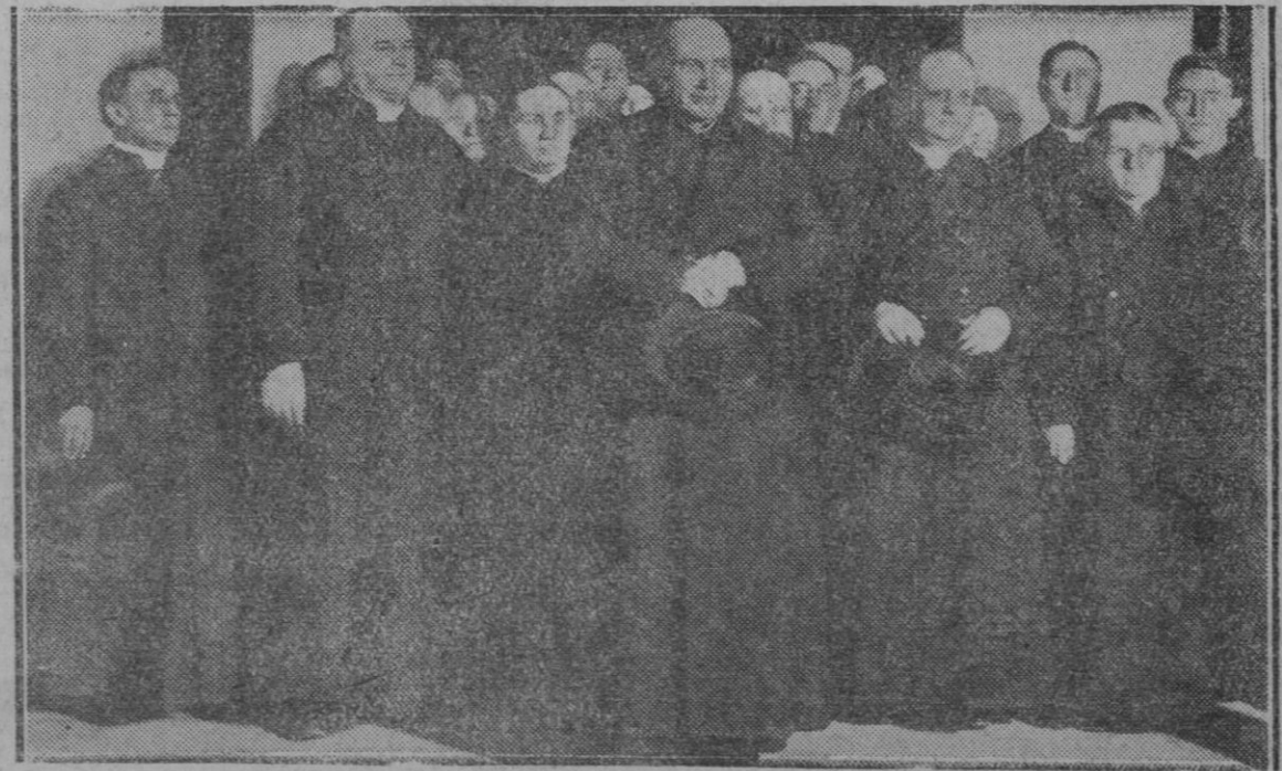
El primado de Toledo, cardenal Segura, rodeado de las autoridades eclesiásticas y civiles que acudieron a la estación de Roma para recibirle

— Id.: fin Mayo 1925: circulación, 747 id.; precios, 118; cambio dolar, a la par.