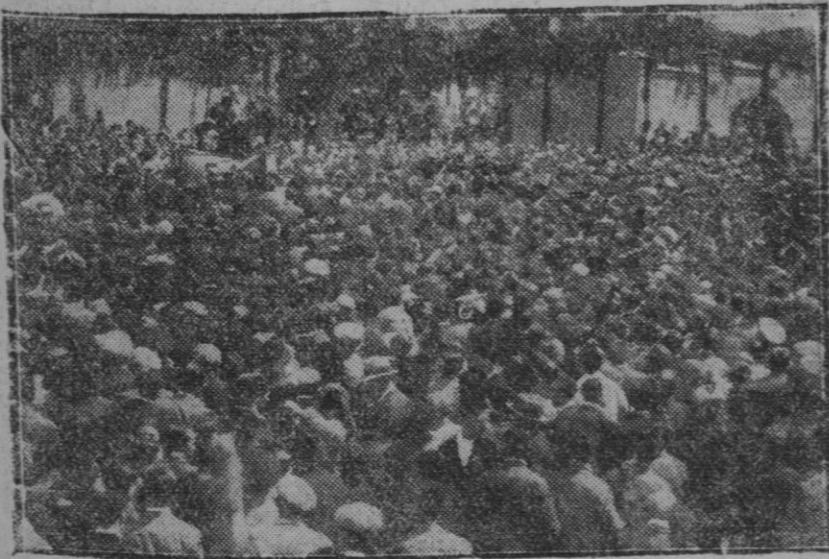
MADRID.—La manifestación a la memoria de Pablo Iglesias.—El ministro de Hacienda D. Indalecio Prieto pronunciando un discurso en el cementerio

Casi todos deben recordar también que a causa de haber recaído contra él algo de culpabilidad en la muerte de un artista, aún cuando no se pudo probar claramente su intervención en el escandaloso suceso, los americanos, que en cuestiones de moralidad no transigen, en virtud del gran poder de sus "ligas moralistas", el simpático astro