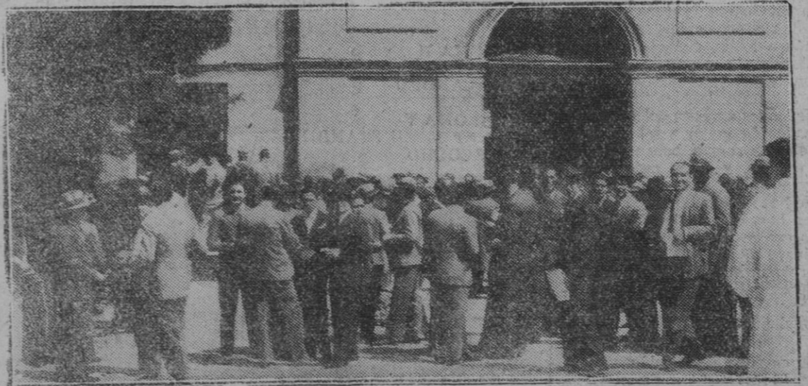
MADRID.—La reanudación de clases.—Los estudiantes en el patio de la Facultad de Medicina, disponiéndose a entrar a sus respectivas clases.