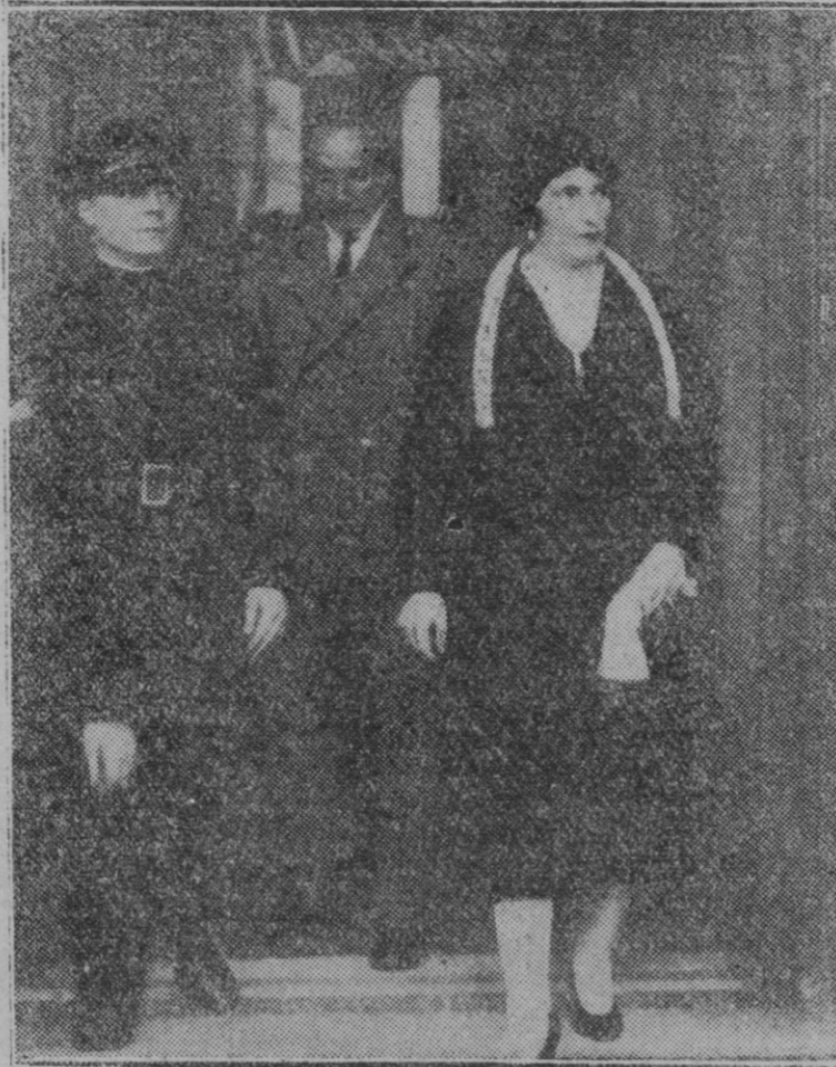
FRANCIA.—La primera salida de la Reina doña Victoria, después de su llegada a París, para dar un corto paseo por la ciudad. La Soberana, al salir del Hotel Maurice

Las personas que esperaban en la calle de Quintana sintieron el ruido del coche y acudieron rápidas a saludar a la infanta. Sinceros y emocionantes oyéronse algunos vivas y palmas que no dejó prolongar la prudencia y el dolor. Y así abandonó Madrid la infanta generosa y buena que en