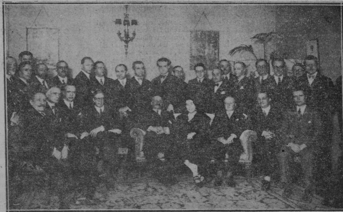
MADRID.—Almuerzo ofrecido al conde de Romanones, por la asociación de la Prensa Extranjera.

A Leonardo de Vinci se le han subido a las barbas, dándole una lección de puntos con las cartas boca arriba. Hay en Milán, frente al teatro de la