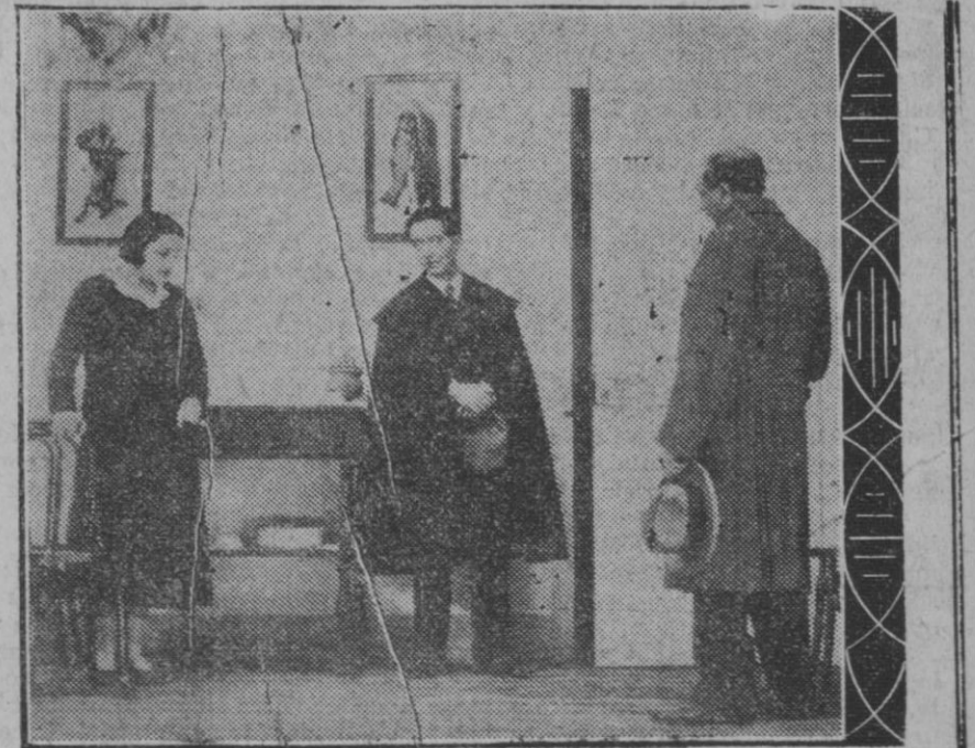
MADRID.—Una escena de la obra "La de los claveles dobles," en el teatro Fontalba

Que el admirado Antonio Rublos no pierda nunca su alegría seria y su seriedad alegre. Ni mayor respeto lo merece por eso. Recuerdo un gran pedagogo inglés que solía jugar descaudadamente con sus alumnos, como un