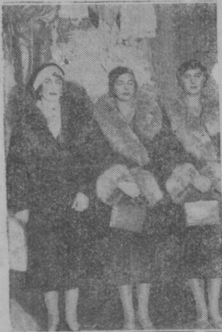
MADRID.—Su Majestad la Reina, acompañada de las infantas doña Beatriz y doña Cristina, en la inauguración del Ropero de la Reina Victoria