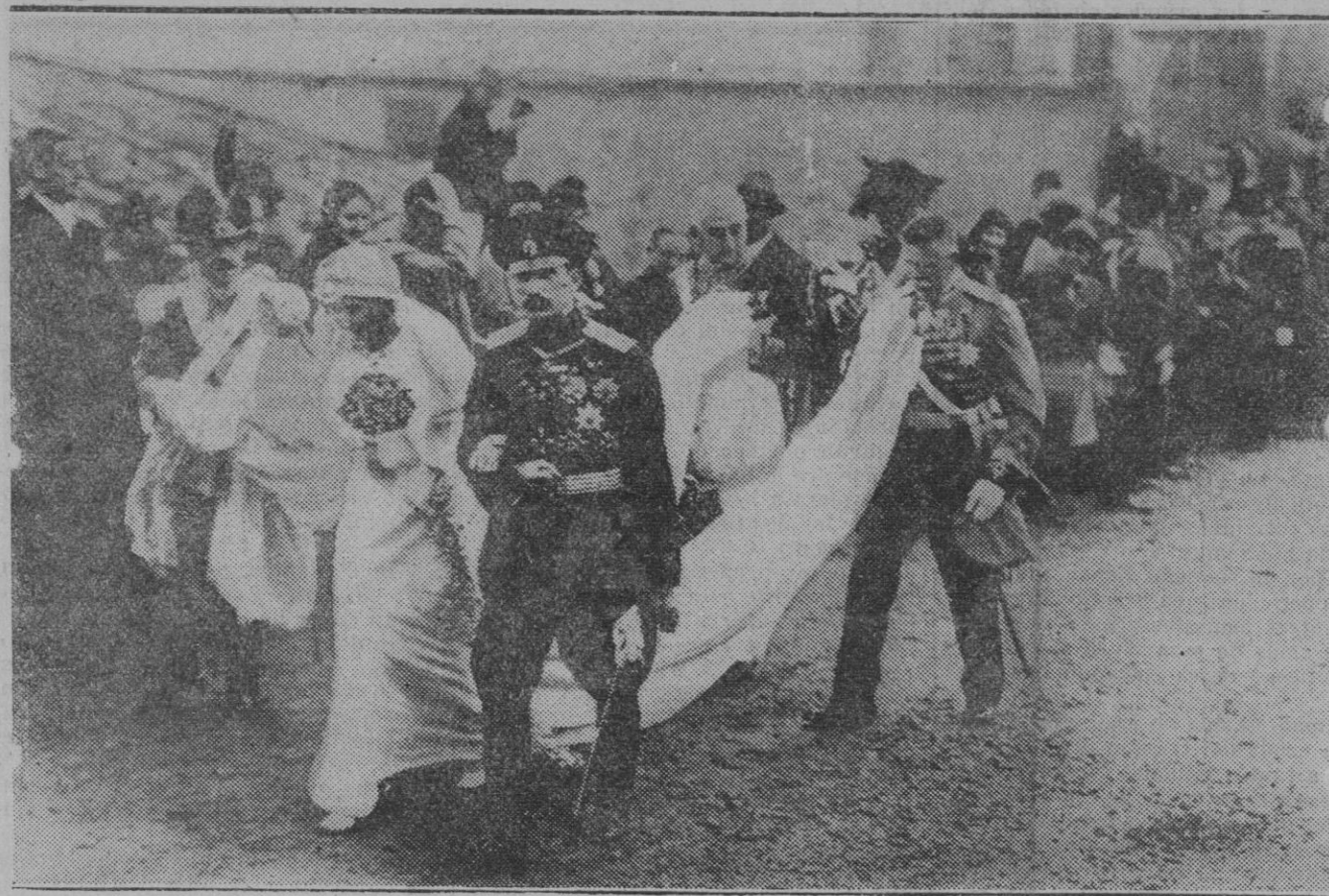
BODA REGIA.—La princesa Juana de Italia y el Rey Boris de Bulgaria al salir de la Basílica, después de celebrada su boda

España ha desaprovechado la ocasión excepcional de la Dictadura sin lograr evitar el bochorno de que provincias enteras pertenezcan a media docena de terratenientes que no sien-