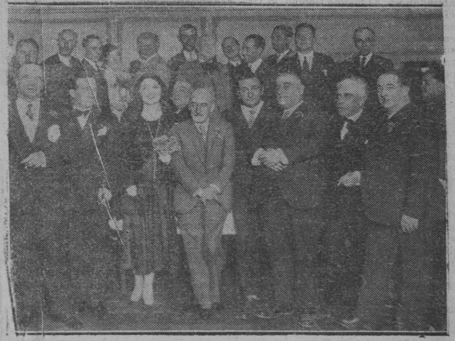
MADRID.—Un grupo de concurrentes al banquete celebrado en el Reina Victoria en honor del poeta Chamizo acto en que asistieron artistas y actores y el célebre autor don Jacinto Benavente