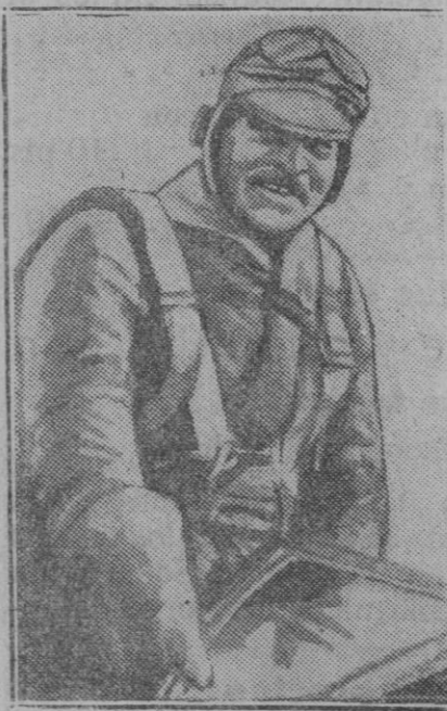
INGLATERRA.—El Jefe del Gobierno laborista, Ramsay Mac Donnell, que casi todos sus viajes los realiza en avión. He aquí el primer inglés en retrato poco conocido

Se espera que la nueva demanda de divorcio presentada por la descontentadiza señora sea igualmente rechazada ahora, pues no hay nadie que crea que hay suficientes motivos para separarse de un esposo porque éste sea cariñoso con su mujer.