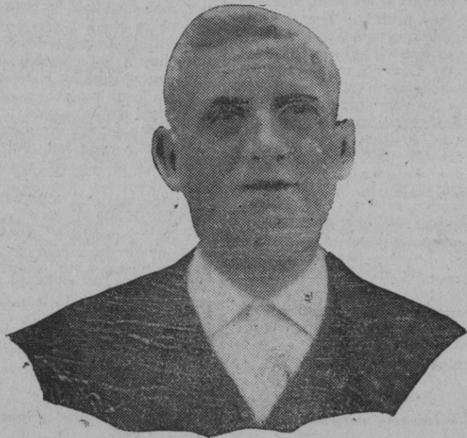
Don Monserrate Galmés Galmés, Alcalde de Petra