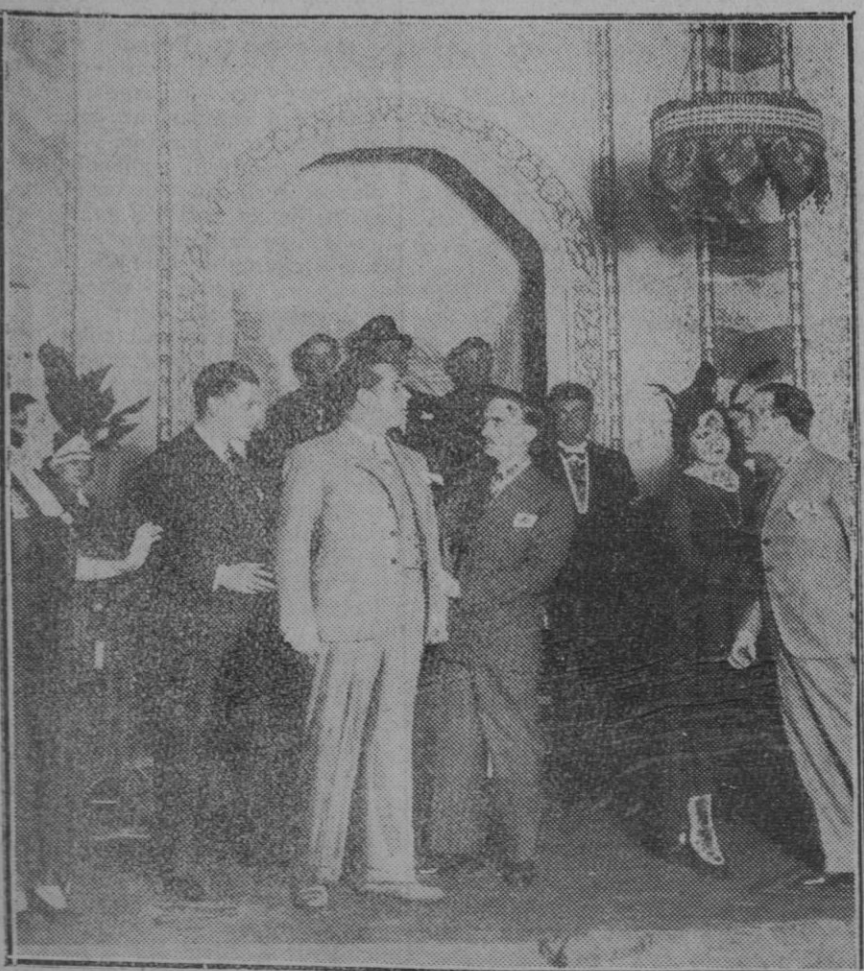
MADRID.—Una escena de la comedia "La divina ficción" original de Luigi Chiarelli, cuyo estreno se celebró en el teatro Cómico