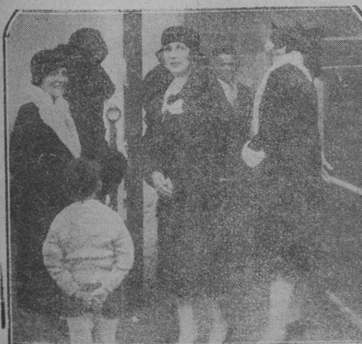
MADRID.—Doña Victoria y el Deporte Hípico.—Su Majestad la Reina, en el Hipódromo, durante las carreras de caballos celebradas en esta Corte.