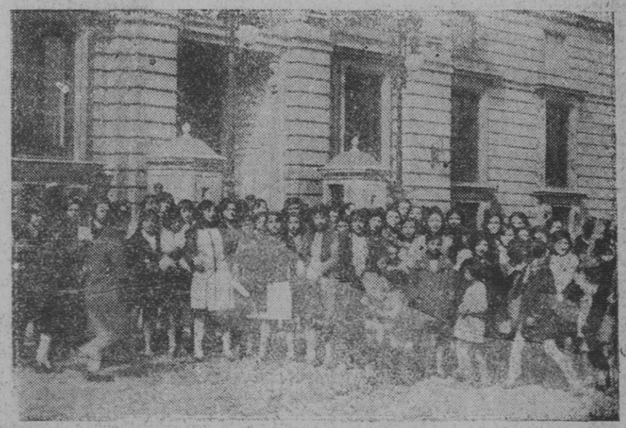
MADRID.—Acto de adhesión a la Monarquía. Jóvenes modistas que durante toda la mañana de ayer testimonio sus firmas en los álbumes colocados en Palacio como testimonio de adhesión a la Monarquía