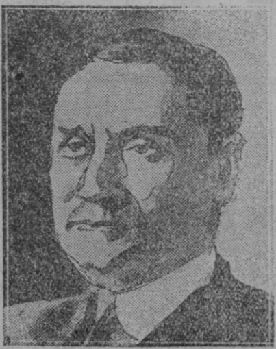
M. Switalski, presidente del Consejo de Ministros polaco, que presentó la dimisión al Jefe del Estado señor Moscieni.