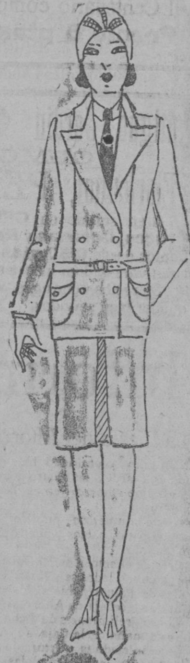
TRAJE DE MAÑANA.—Práctico traje para las mañanas de forma deportiva confeccionado en reps de lana claro

Se tiene en remojo durante una noche entera en una maceta de barro, bien limpia, y un trozo de franela. Después se coloca la mantequilla sobre un plato, se pone encima cada día un trozo de franela húmeda, y se recubre ésta con el trozo de franela que se seguirá mojando ligeramente cada día.