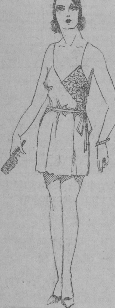
CAMISA.—Linda camisa en muselina lila pálido combinada con encaje del mismo color