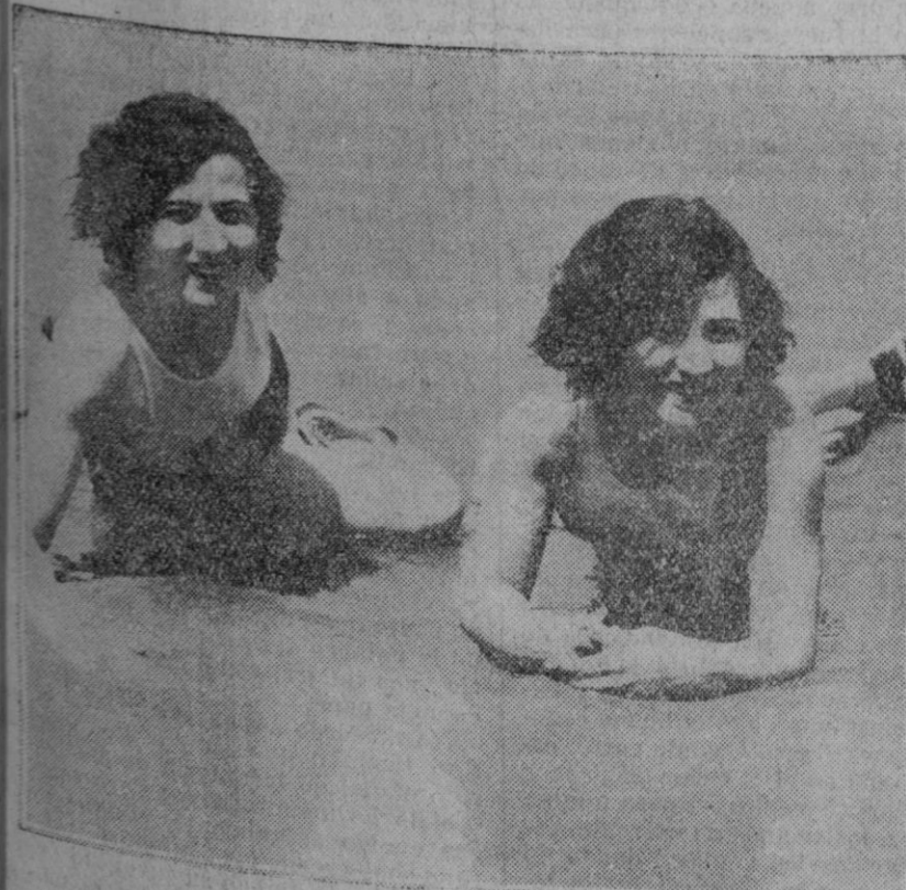
SAN SEBASTIAN.—Dos bellas bañistas tomando un baño de sol en la aristocrática playa de Ondarieta.

Refiriéndose a rápido desenvolvimiento de la Radio, dice el doctor Klein que no hace nueve años (el 2 de Noviembre de 1920) empezó a funcionar la primera estación radiotelegráfica comercial, que inició sus emisiones radiando la noticia de la victoria del difunto Presidente de la República Warren G. Harding. "Aquel día la noche—continúa—sólo había una estación en el mundo del aire. Esta noche hay más de seiscientos en los Estados Unidos y pasan de quinientas las establecidas en los demás países..."